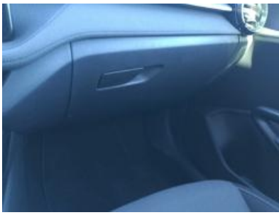
Imagen - 10