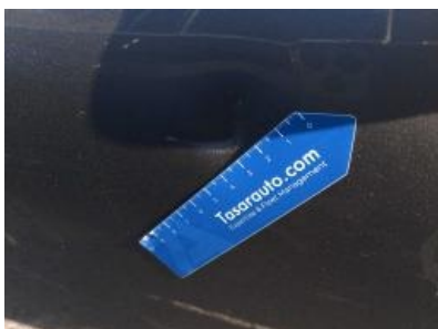
Imagen - 38