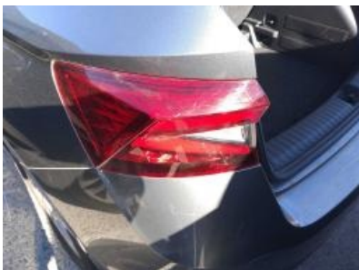
Imagen - 28