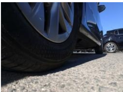
Imagen - 31