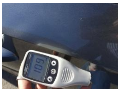
Imagen - 36