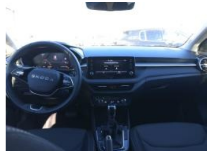
Imagen - 21