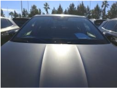
Imagen - 5