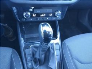
Imagen - 9