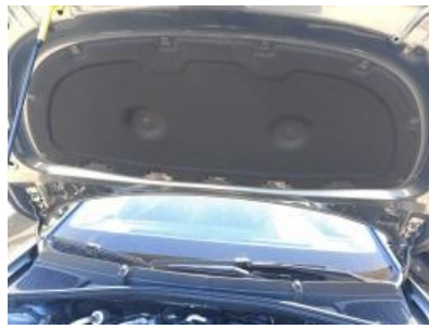
Imagen - 11