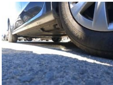
Imagen - 30