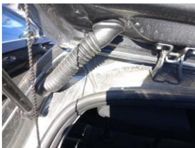
Imagen - 26