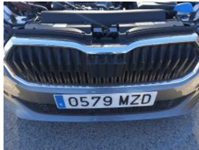
Imagen - 17