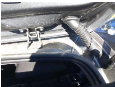
Imagen - 25