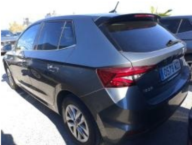
Imagen - 2