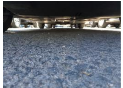
Imagen - 18