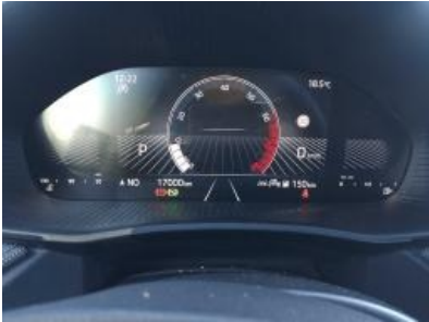
Imagen - 7