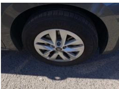
Imagen - 34