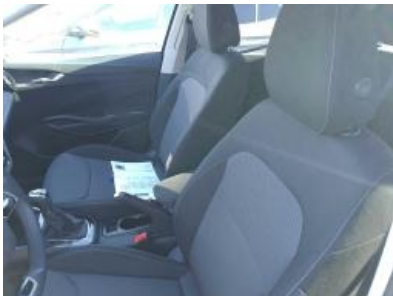
Imagen - 19