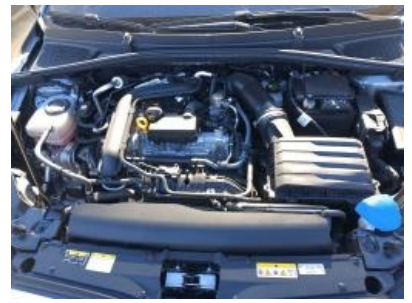
Imagen - 12