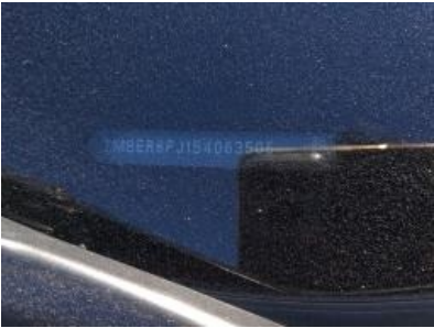
Imagen - 6