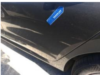
Imagen - 37