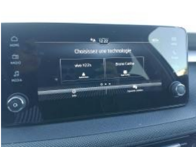
Imagen - 8