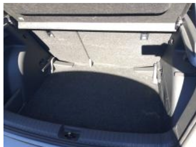
Imagen - 23