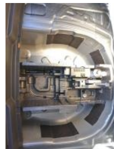
Imagen - 24