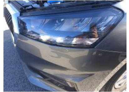
Imagen - 15