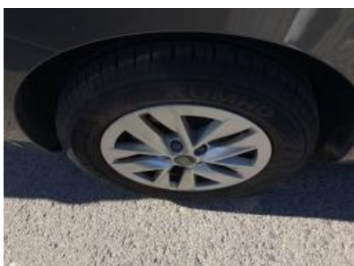
Imagen - 35