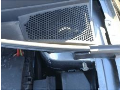
Imagen - 13