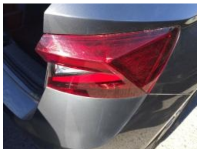
Imagen - 27