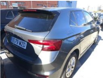
Imagen - 3