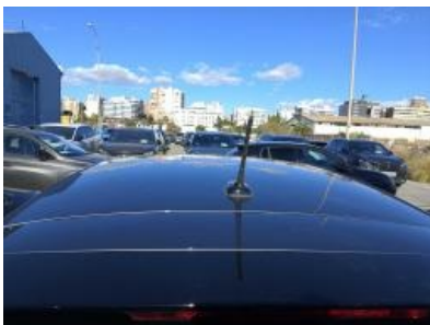
Imagen - 22