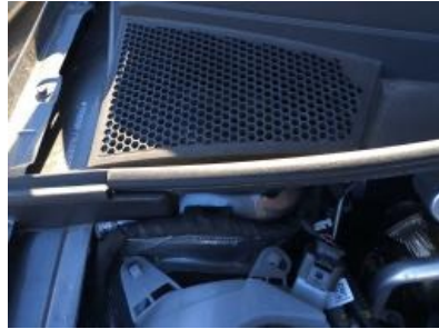
Imagen - 14