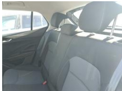
Imagen - 20