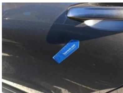
Imagen - 39