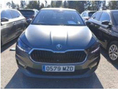
Imagen - 4