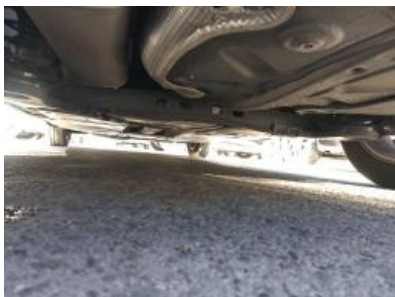
Imagen - 29