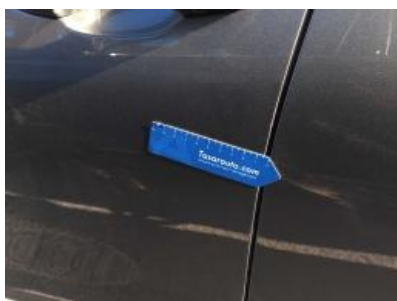
Imagen - 40