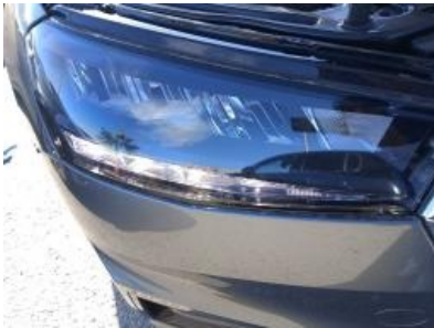
Imagen - 16