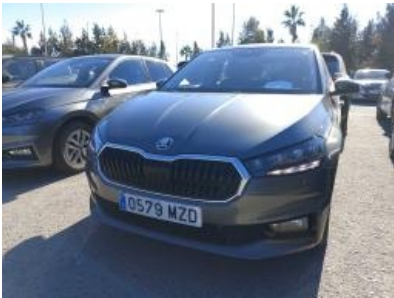
Imagen - 1