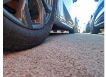
Imagen - 45