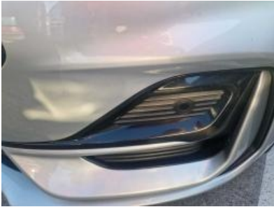
Imagen - 13