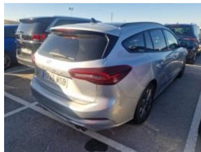
Imagen - 5