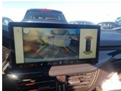
Imagen - 20