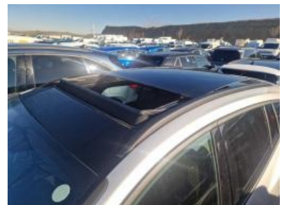
Imagen - 24