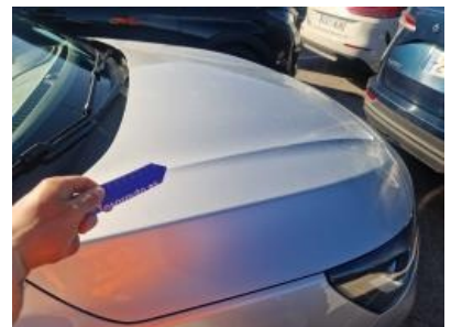
Imagen - 54