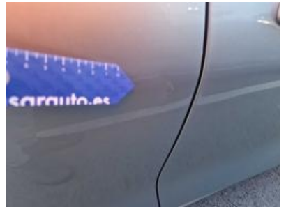
Imagen - 63