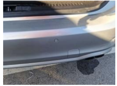
Imagen - 42