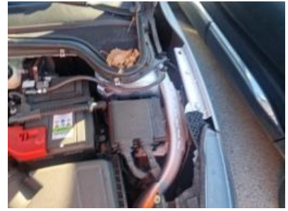
Imagen - 27