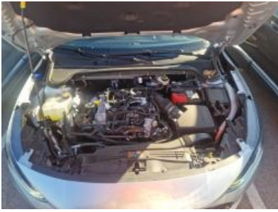
Imagen - 25