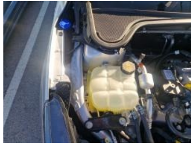
Imagen - 26