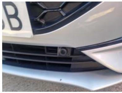
Imagen - 11