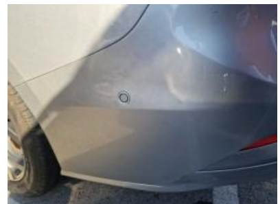
Imagen - 39