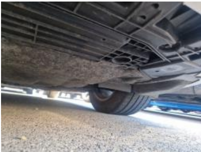
Imagen - 16