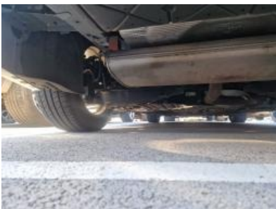
Imagen - 37