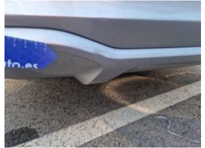
Imagen - 60