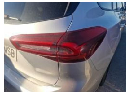
Imagen - 6