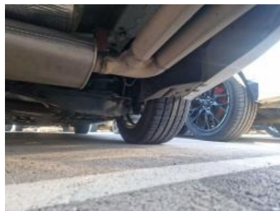
Imagen - 38