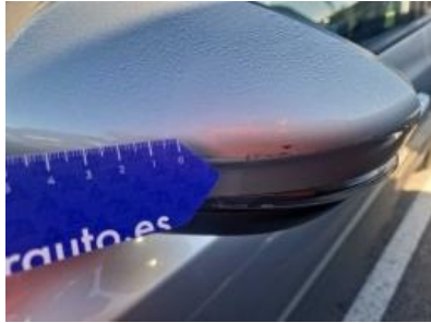
Imagen - 59