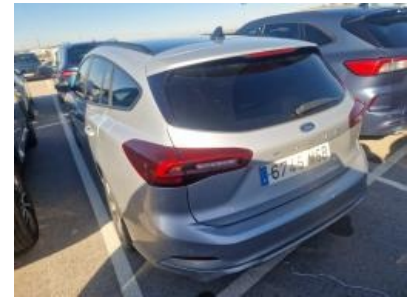
Imagen - 3