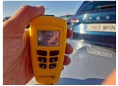
Imagen - 57