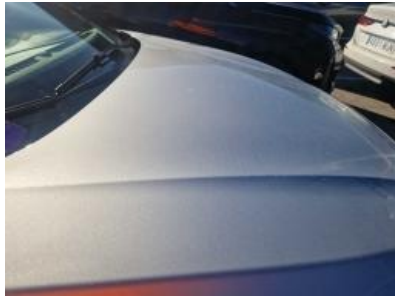
Imagen - 56