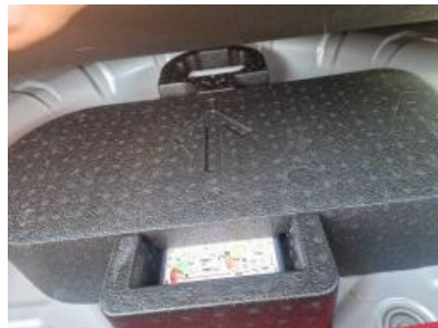
Imagen - 35