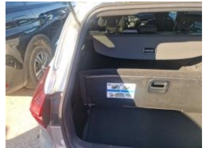
Imagen - 33