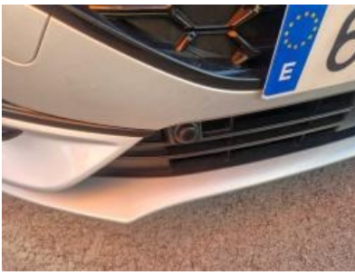
Imagen - 10