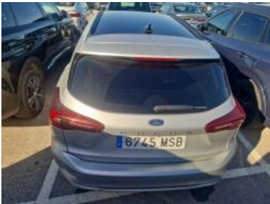
Imagen - 31