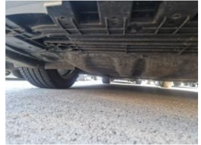
Imagen - 15