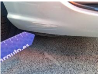
Imagen - 52