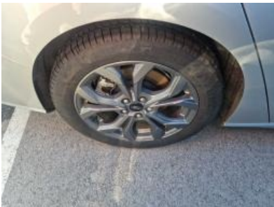
Imagen - 49