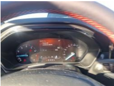
Imagen - 19