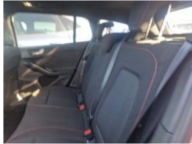
Imagen - 29