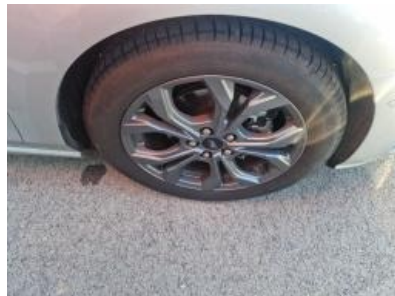
Imagen - 50