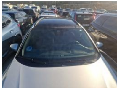
Imagen - 17