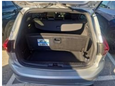
Imagen - 32