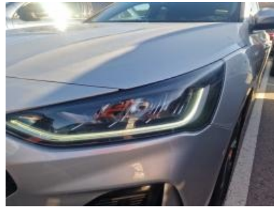
Imagen - 2