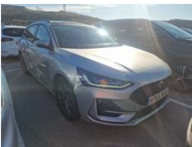
Imagen - 7