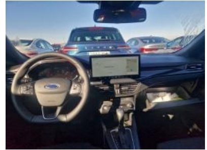
Imagen - 30