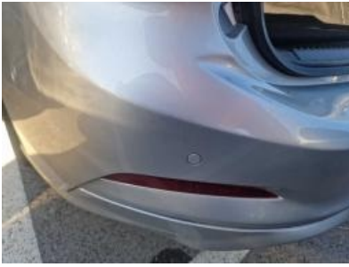
Imagen - 40