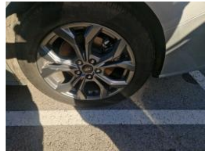
Imagen - 48