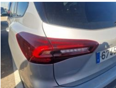
Imagen - 4