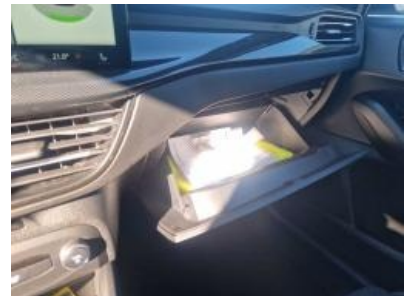
Imagen - 21