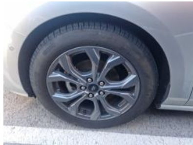
Imagen - 47