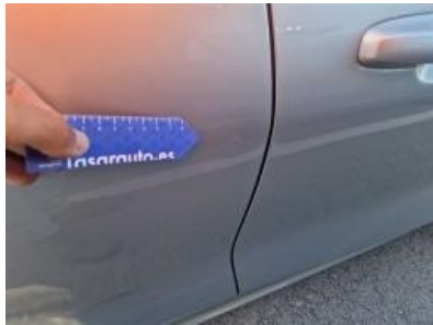
Imagen - 62