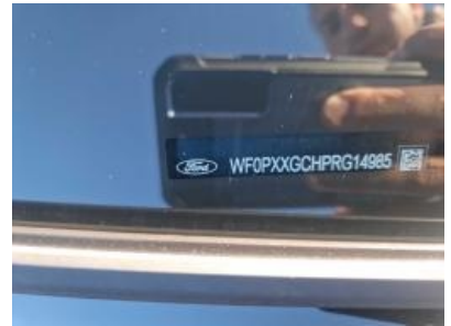
Imagen - 18