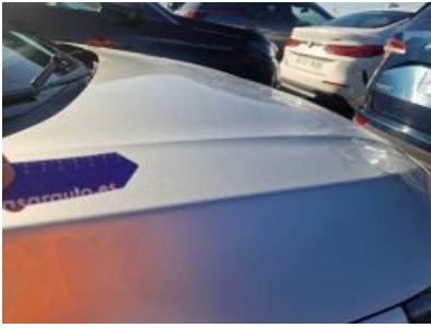
Imagen - 55