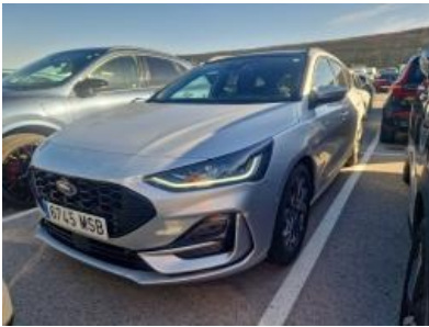
Imagen - 1