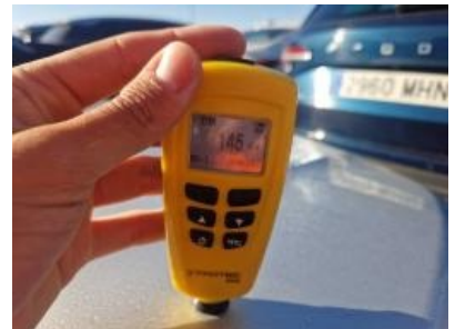
Imagen - 51