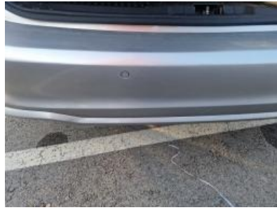
Imagen - 41