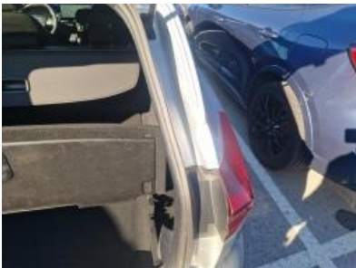
Imagen - 34