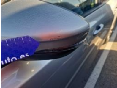
Imagen - 58