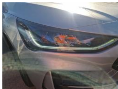
Imagen - 8