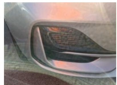
Imagen - 9