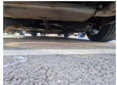
Imagen - 36