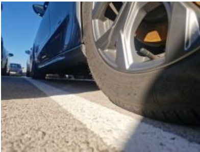
Imagen - 46