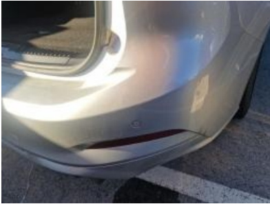
Imagen - 43