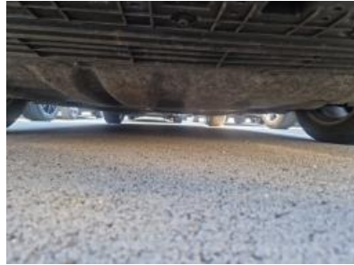
Imagen - 14