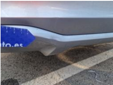
Imagen - 61