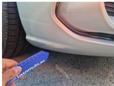
Imagen - 53