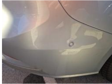
Imagen - 44