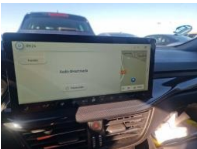
Imagen - 22