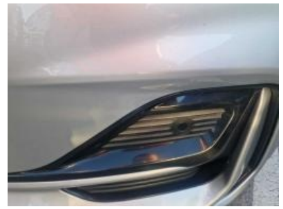
Imagen - 12