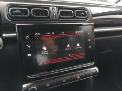
Immagine - 9