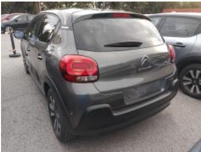
Immagine - 2