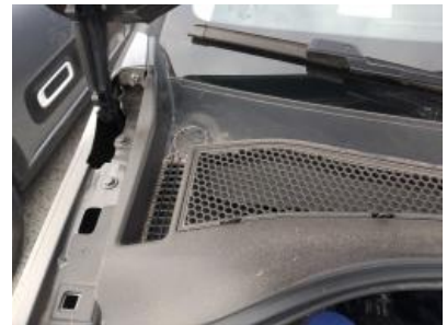
Immagine - 15