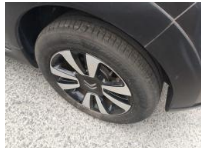
Immagine - 33