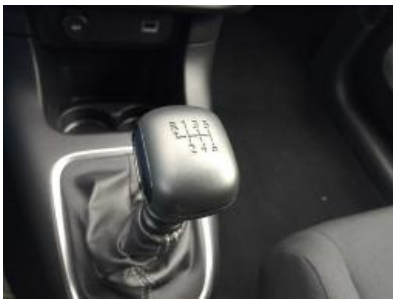
Immagine - 10