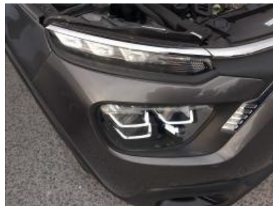
Immagine - 17