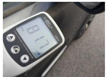
Immagine - 36