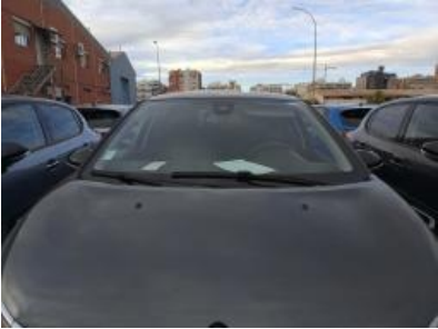
Immagine - 6