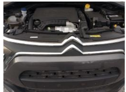
Immagine - 18