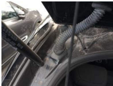
Immagine - 26