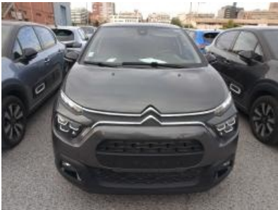
Immagine - 1