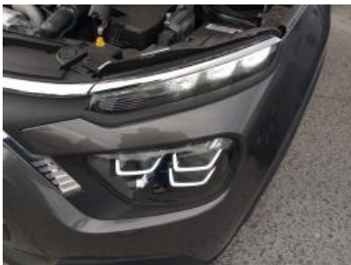
Immagine - 16