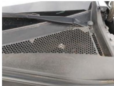
Immagine - 14