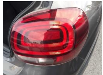
Immagine - 27