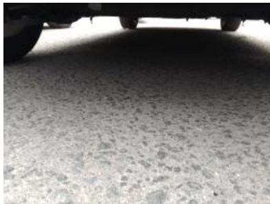
Immagine - 29