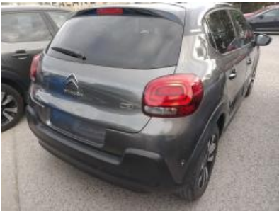
Immagine - 3