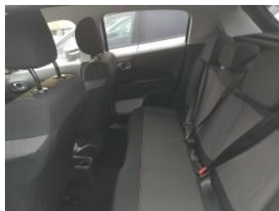
Immagine - 20