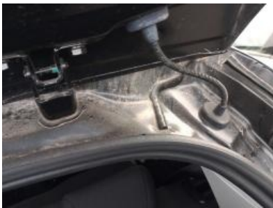
Immagine - 25