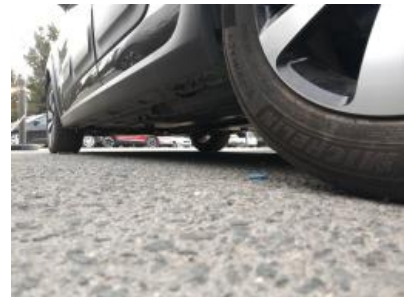
Immagine - 30