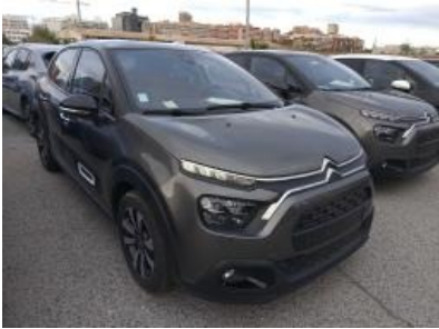
Immagine - 4