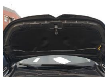
Immagine - 12