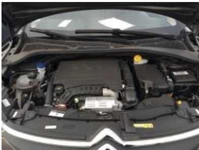
Immagine - 13