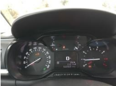
Immagine - 8