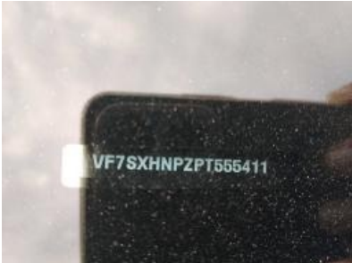
Immagine - 7