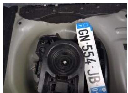
Immagine - 24