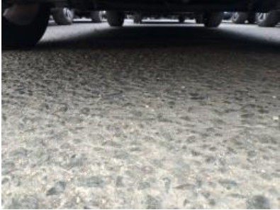
Immagine - 5