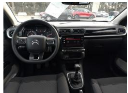
Immagine - 21