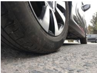
Immagine - 31