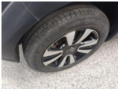
Immagine - 32