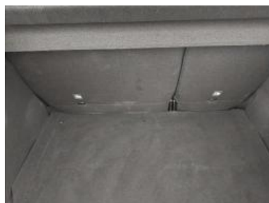
Immagine - 23