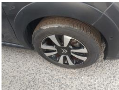
Immagine - 35