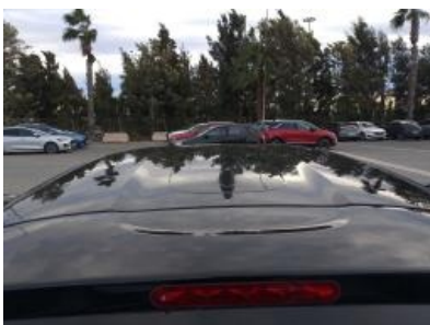
Immagine - 22