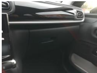
Immagine - 11