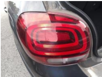
Immagine - 28