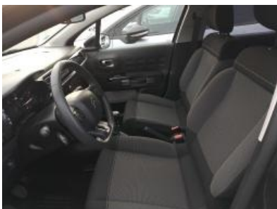
Immagine - 19