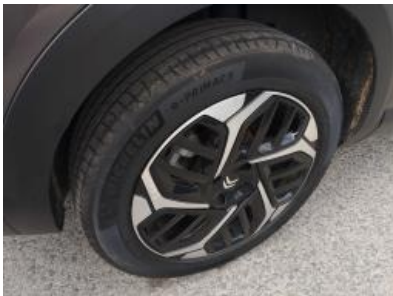
Imagen - 34