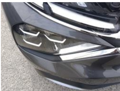
Imagen - 19