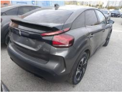
Imagen - 4