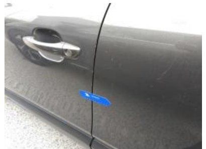
Imagen - 39