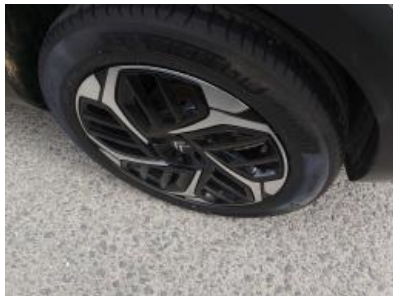
Imagen - 35