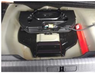
Imagen - 26