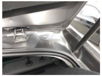
Imagen - 27