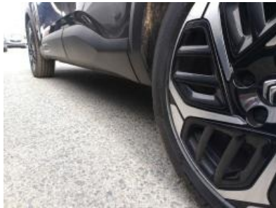
Imagen - 32