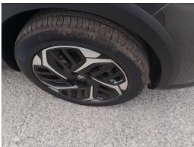
Imagen - 37