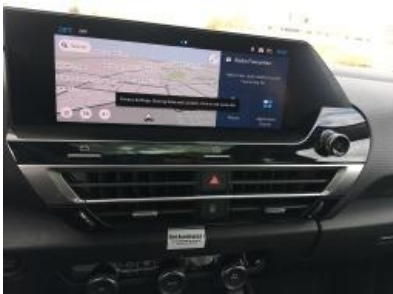
Imagen - 10