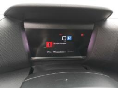
Imagen - 9