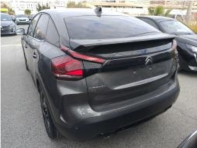
Imagen - 3