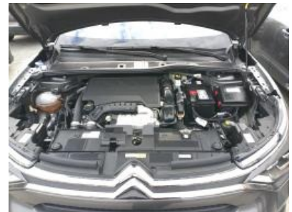
Imagen - 15