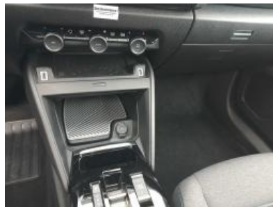
Imagen - 11