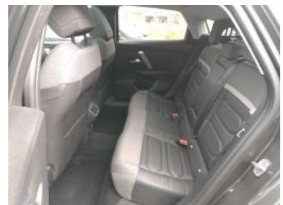
Imagen - 21