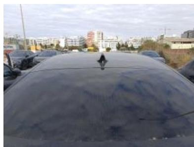
Imagen - 23