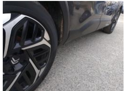
Imagen - 33