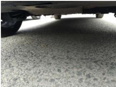
Imagen - 31