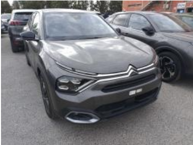
Imagen - 1