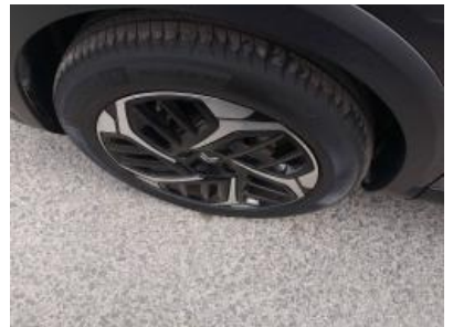
Imagen - 36