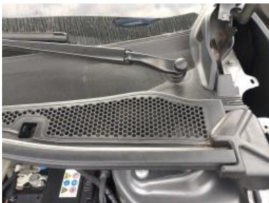
Imagen - 16