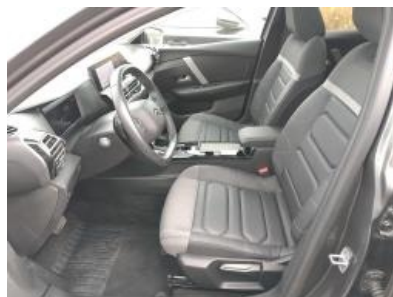
Imagen - 20