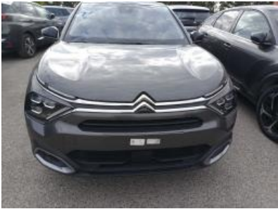
Imagen - 5