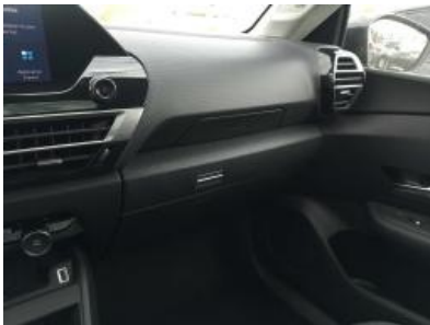
Imagen - 13