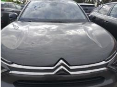
Imagen - 7