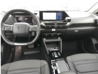
Imagen - 22