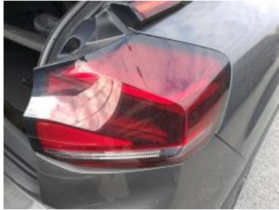
Imagen - 29