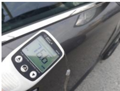
Imagen - 38