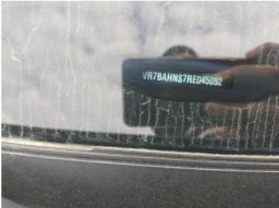
Imagen - 8