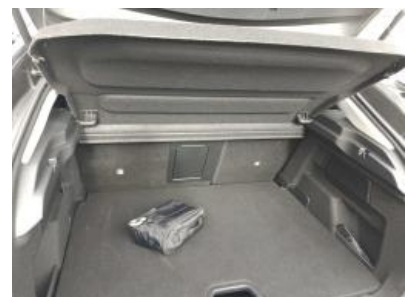
Imagen - 24