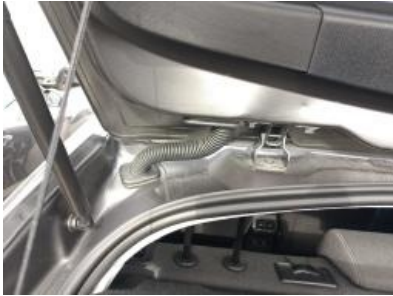
Imagen - 28