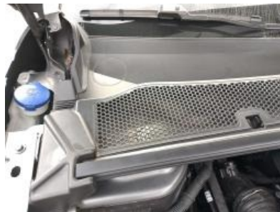
Imagen - 17