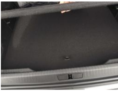
Imagen - 25