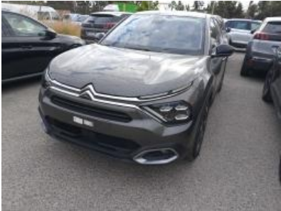
Imagen - 2