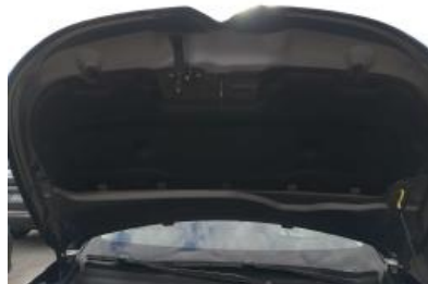
Imagen - 14