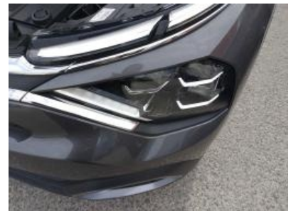
Imagen - 18