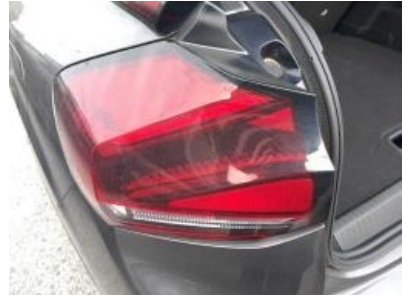
Imagen - 30