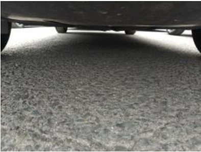
Imagen - 6