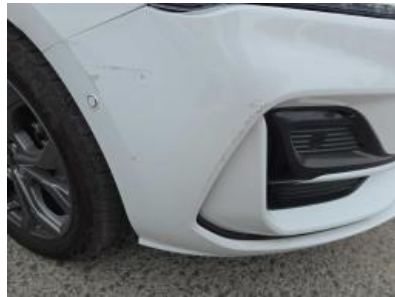
Immagine - 47