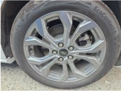
Immagine - 28