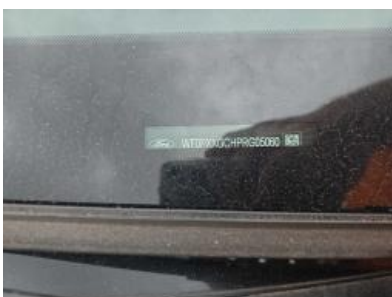
Immagine - 7