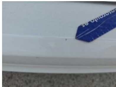
Immagine - 65