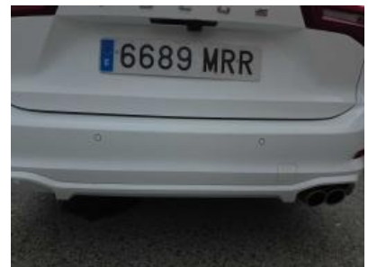
Immagine - 39