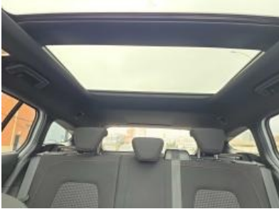
Immagine - 13