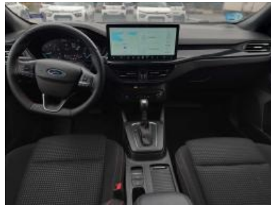
Immagine - 17