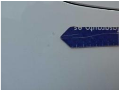
Immagine - 61