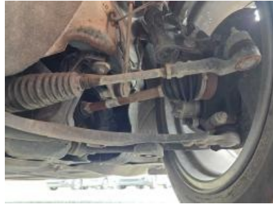
Immagine - 44