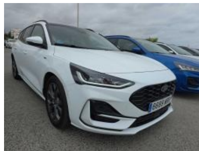
Immagine - 5