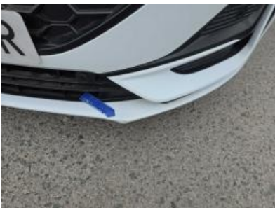
Immagine - 52