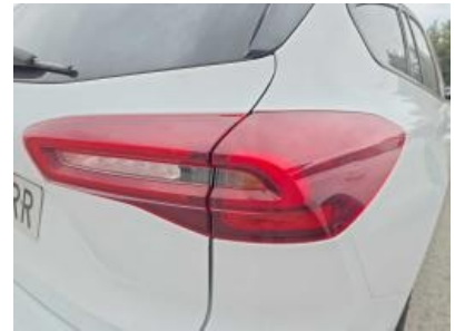
Immagine - 33