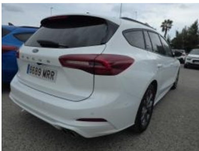
Immagine - 4