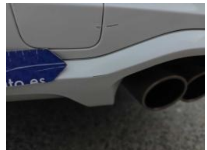
Immagine - 69