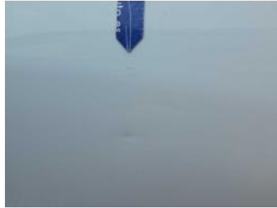
Immagine - 59