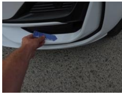
Immagine - 56