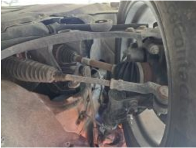
Immagine - 43