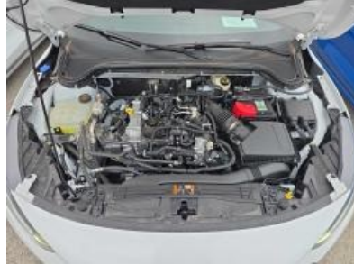
Immagine - 14