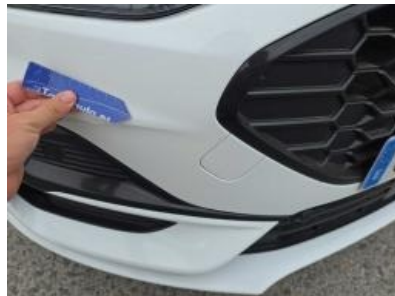
Immagine - 50