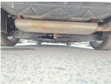
Immagine - 22