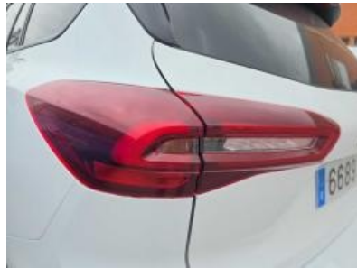
Immagine - 32