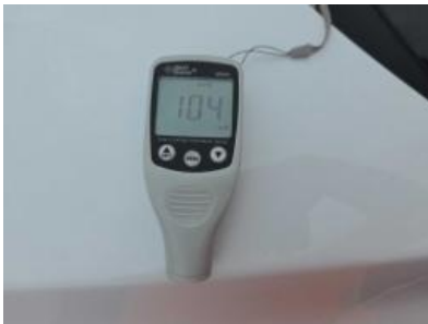
Immagine - 1