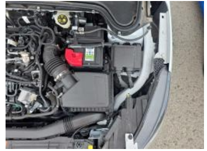
Immagine - 42