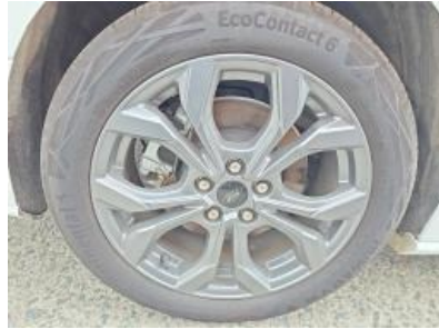
Immagine - 29