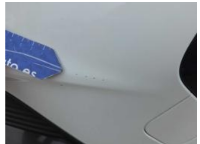
Immagine - 51