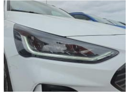
Immagine - 30