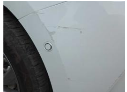
Immagine - 48