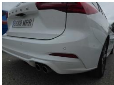
Immagine - 38