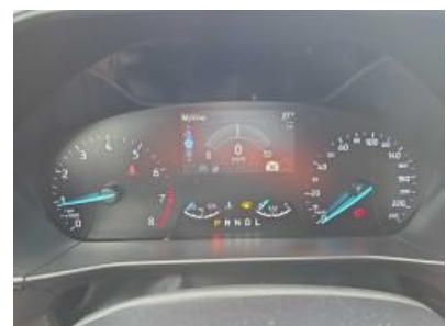
Immagine - 9