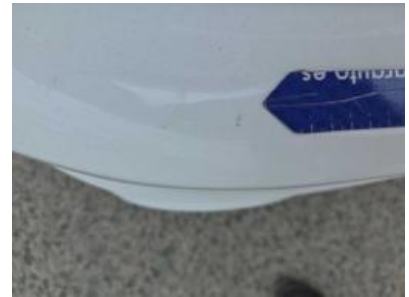
Immagine - 63