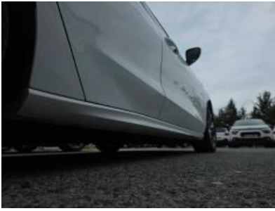
Immagine - 25