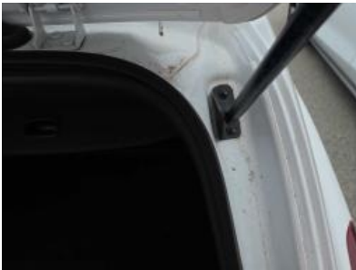
Immagine - 46