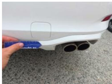
Immagine - 68