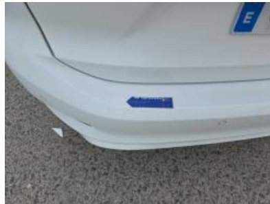
Immagine - 62