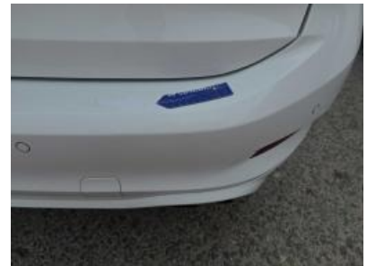
Immagine - 66