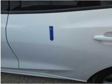
Immagine - 58