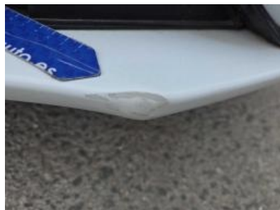
Immagine - 53