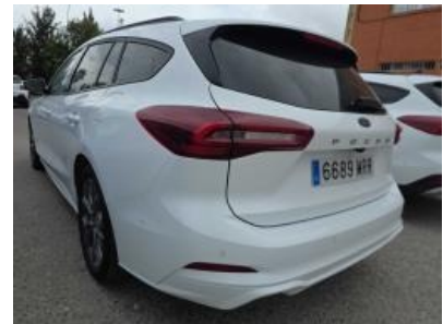
Immagine - 3