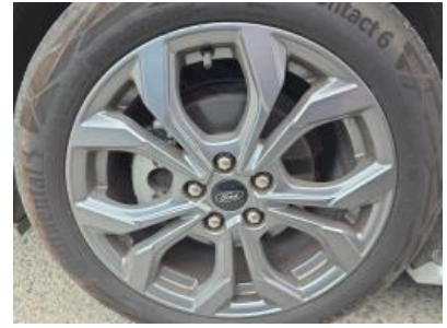
Immagine - 27