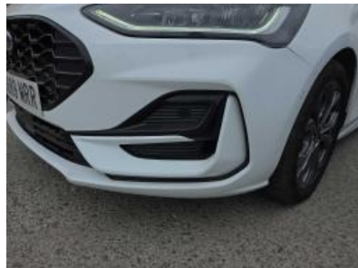
Immagine - 35