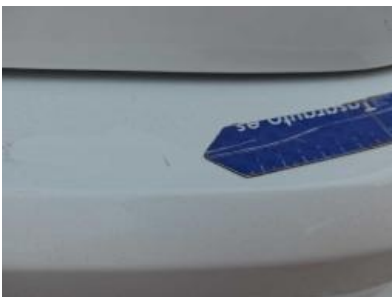
Immagine - 67