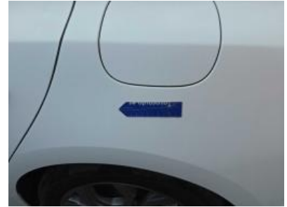
Immagine - 60