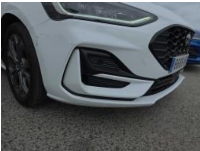
Immagine - 34