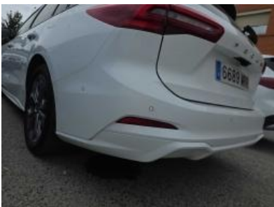
Immagine - 37