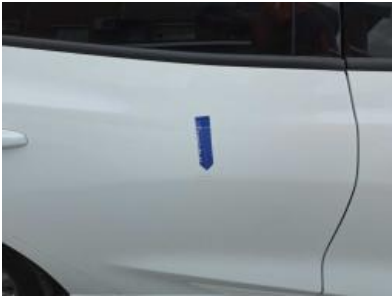
Immagine - 70