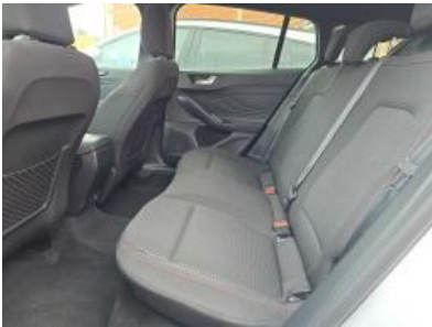
Immagine - 16