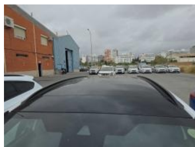
Immagine - 8