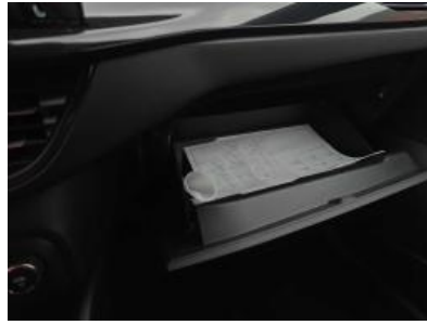
Immagine - 11