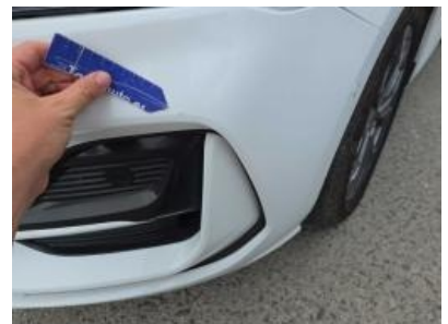
Immagine - 54