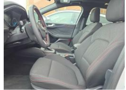
Immagine - 15