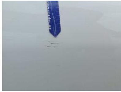
Immagine - 71