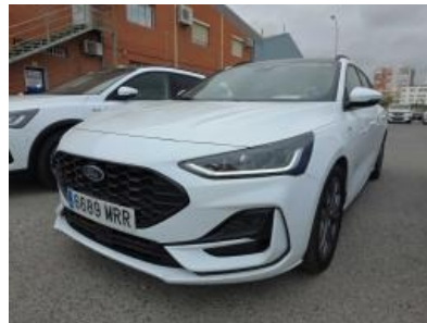
Immagine - 2