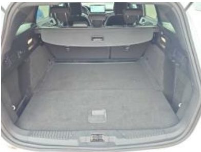
Immagine - 19