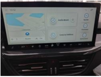
Immagine - 10