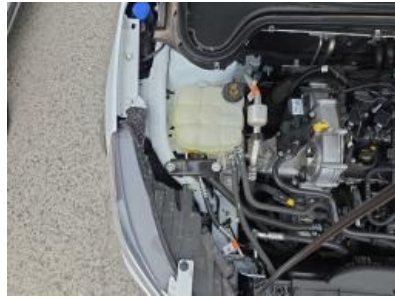
Immagine - 41