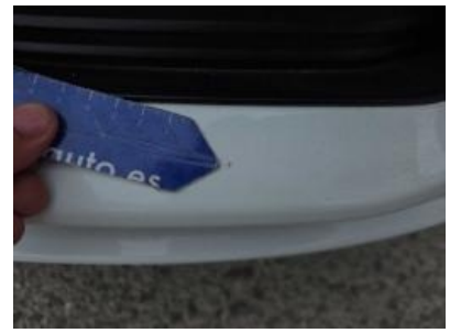
Immagine - 57