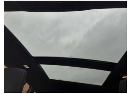
Immagine - 12