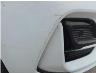
Immagine - 49