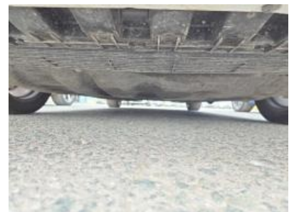
Immagine - 6