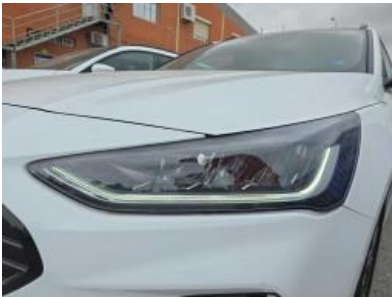
Immagine - 31