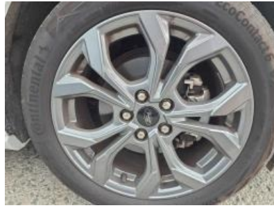
Immagine - 26