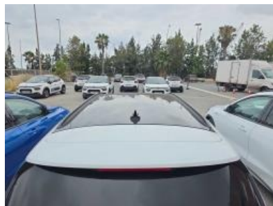
Immagine - 23