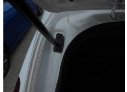
Immagine - 45