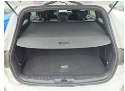
Immagine - 18