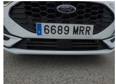
Immagine - 36