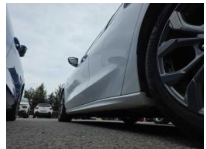
Immagine - 24