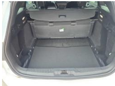
Immagine - 20