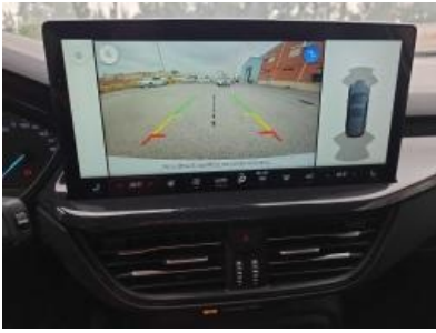
Immagine - 40