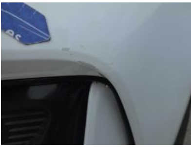
Immagine - 55