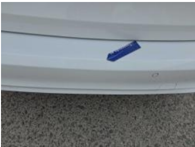
Immagine - 64