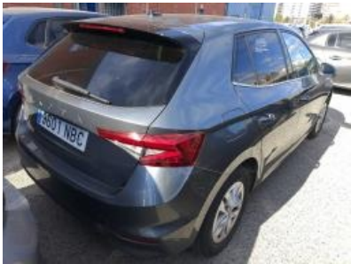
Imagen - 3