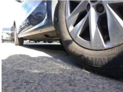
Imagen - 29