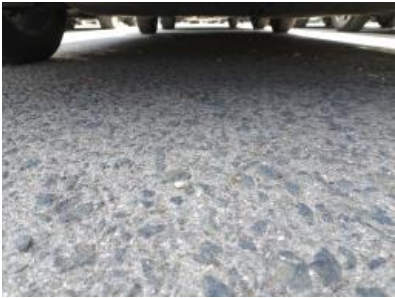
Imagen - 5