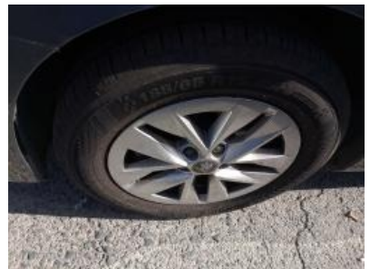
Imagen - 33