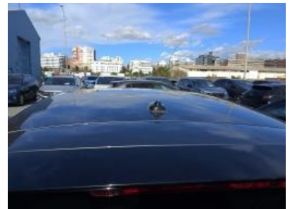
Imagen - 21