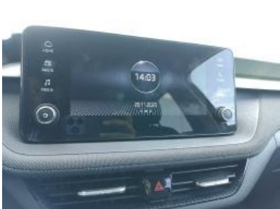
Imagen - 9