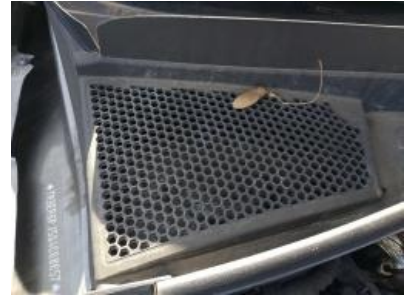
Imagen - 15