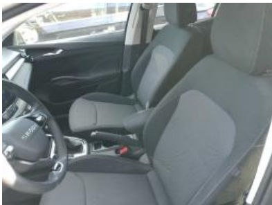
Imagen - 19