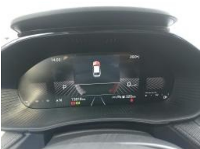
Imagen - 8