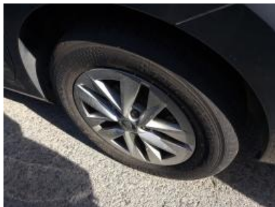
Imagen - 32