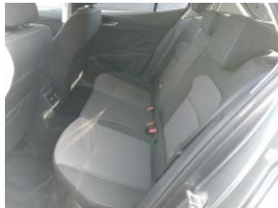
Imagen - 20