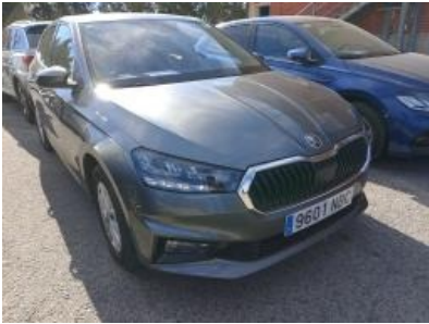
Imagen - 4