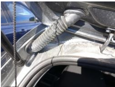
Imagen - 25