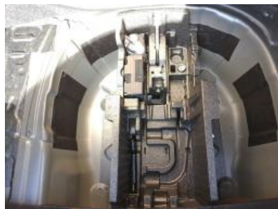
Imagen - 23