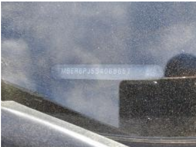
Imagen - 7