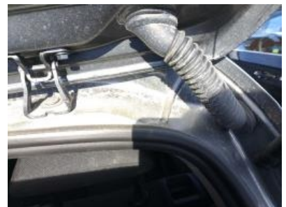
Imagen - 24