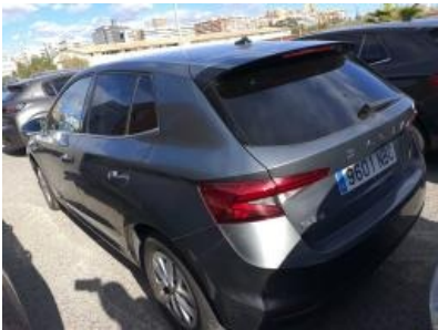
Imagen - 2