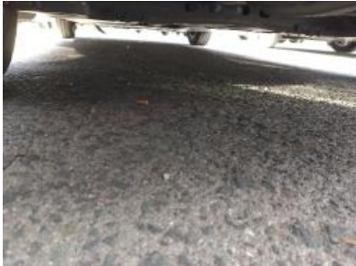
Imagen - 28