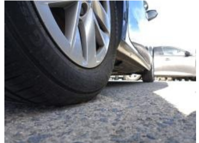
Imagen - 30