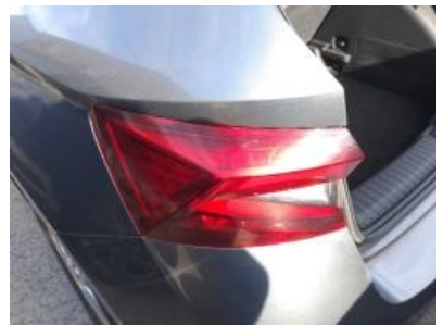
Imagen - 27