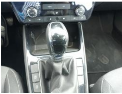
Imagen - 10