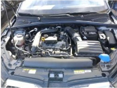
Imagen - 13