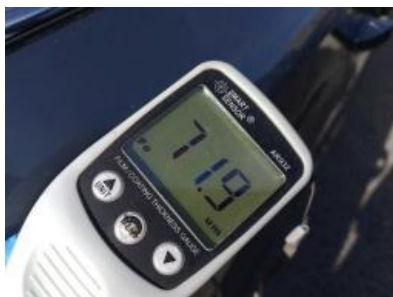
Imagen - 35