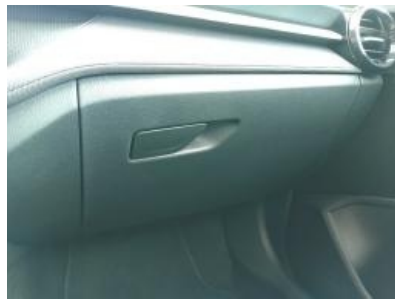
Imagen - 11