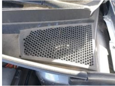
Imagen - 14