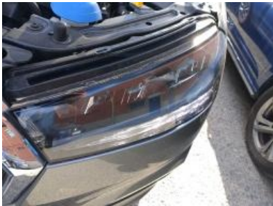
Imagen - 16