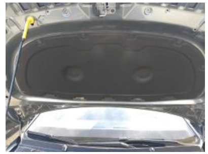
Imagen - 12