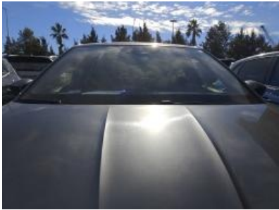
Imagen - 6