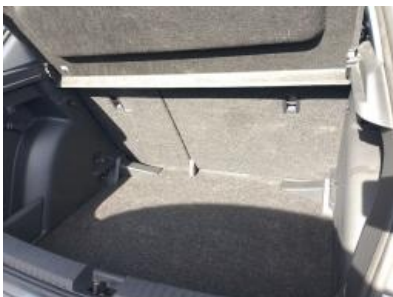
Imagen - 22