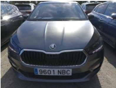
Imagen - 1