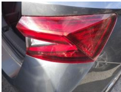
Imagen - 26