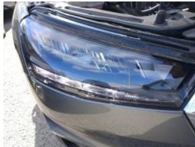
Imagen - 17