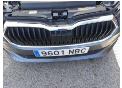
Imagen - 18