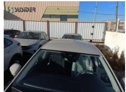
Imagen - 6