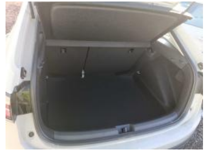
Imagen - 15