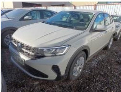
Imagen - 1