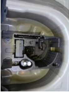
Imagen - 16