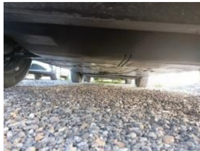
Imagen - 5