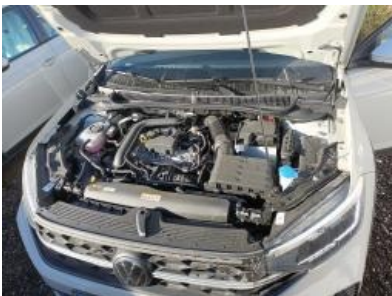
Imagen - 7