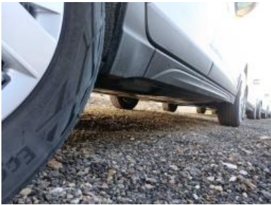
Imagen - 19