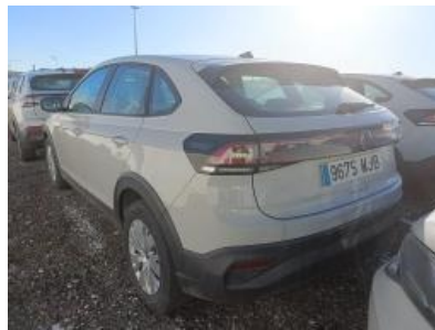
Imagen - 2