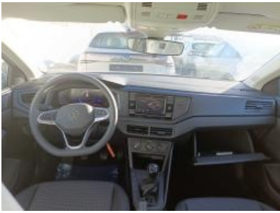
Imagen - 13