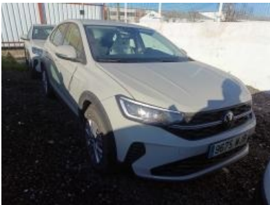
Imagen - 4