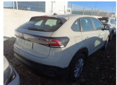
Imagen - 3