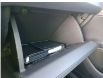
Imagen - 10