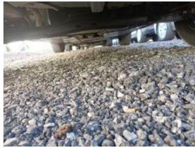
Imagen - 14