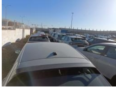
Imagen - 17