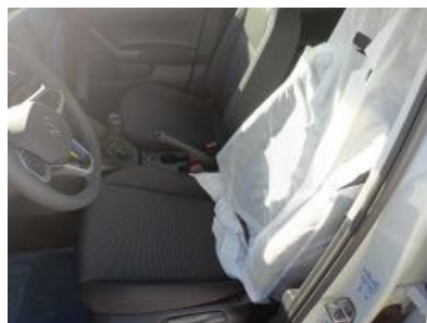
Imagen - 11