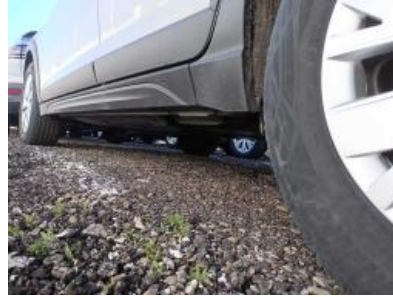
Imagen - 18