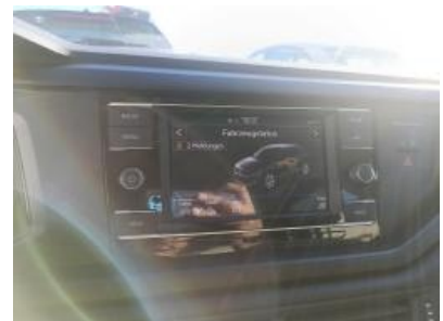
Imagen - 9