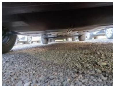
Imagen - 5