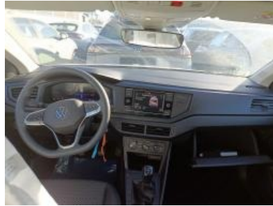
Imagen - 14