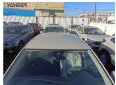
Imagen - 6