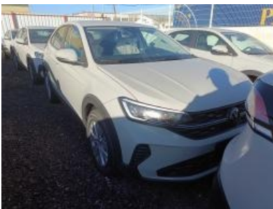
Imagen - 4