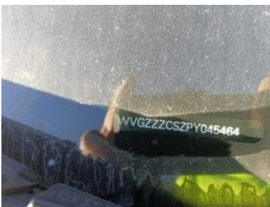
Imagen - 7