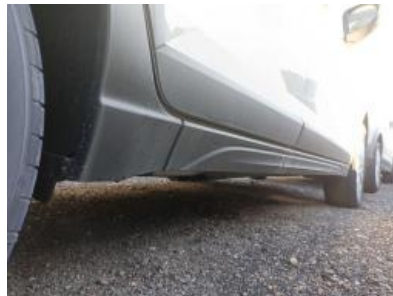
Imagen - 20