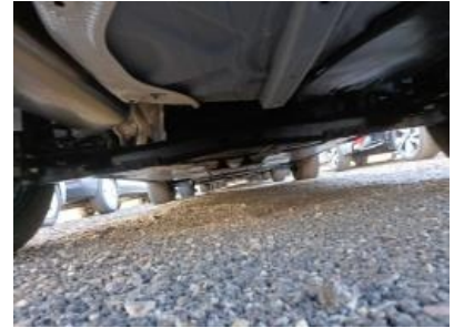
Imagen - 15