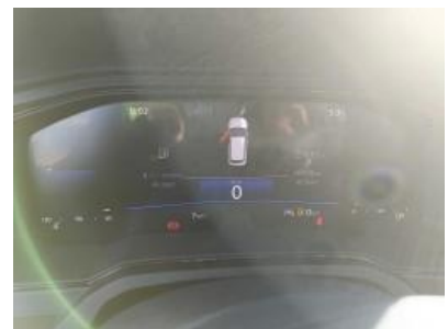
Imagen - 9