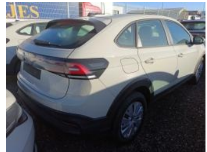
Imagen - 3