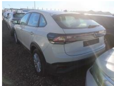
Imagen - 2