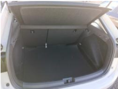
Imagen - 16