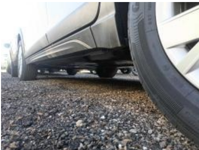
Imagen - 19