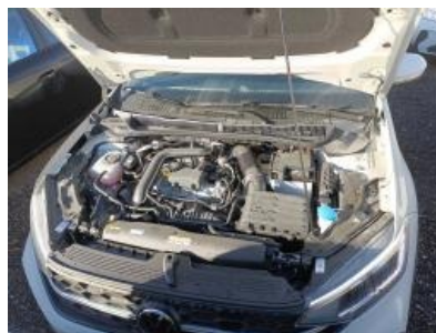
Imagen - 8