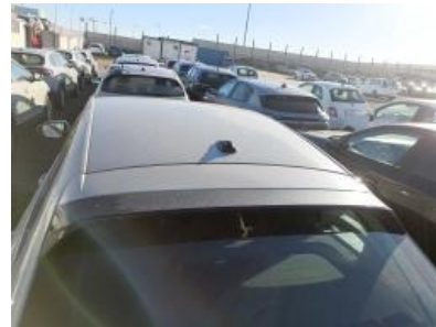
Imagen - 18