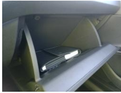
Imagen - 11