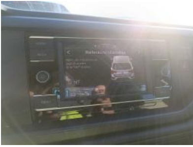
Imagen - 10