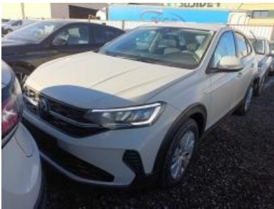
Imagen - 1