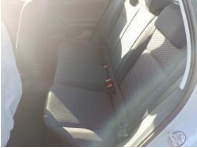
Imagen - 13