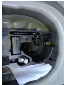
Imagen - 17