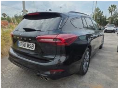
Imagen - 4