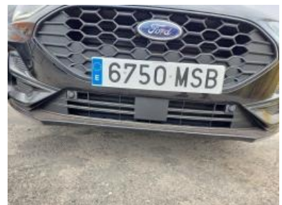
Imagen - 33