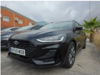
Imagen - 2