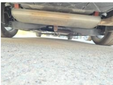
Imagen - 19