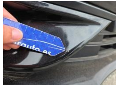
Immagine - 48