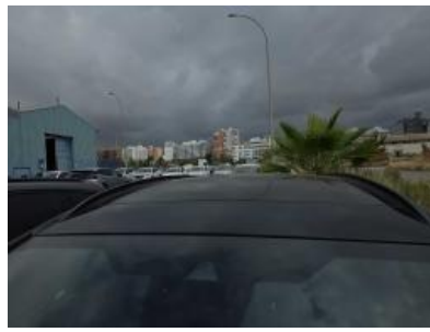
Imagen - 8