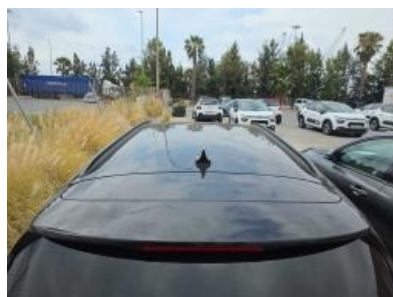
Imagen - 20