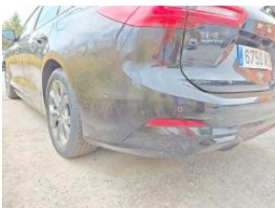
Imagen - 34