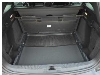
Imagen - 17