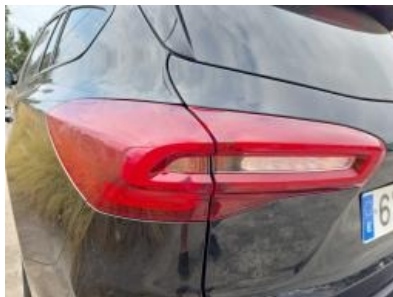
Imagen - 29