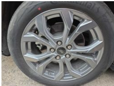
Imagen - 26