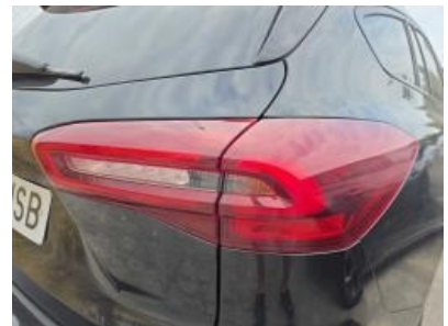
Imagen - 30