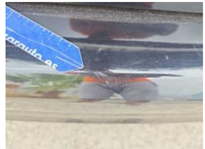
Imagen - 57