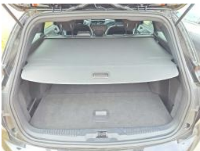
Imagen - 16