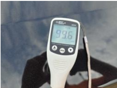
Imagen - 1