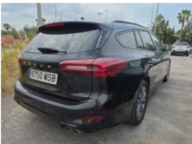
Immagine - 4