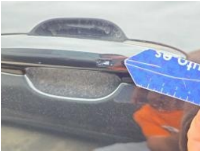
Imagen - 67