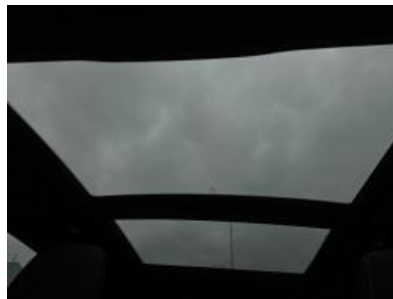
Imagen - 38