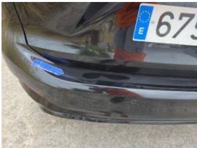
Imagen - 55