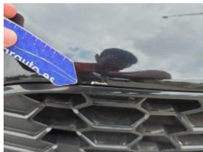
Immagine - 50