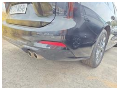
Immagine - 35