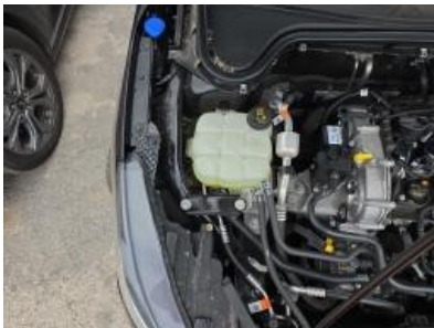
Imagen - 40