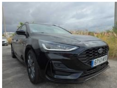
Immagine - 5