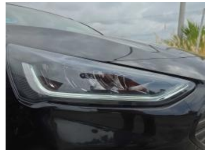
Imagen - 27