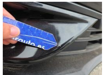
Imagen - 48