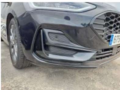
Imagen - 31