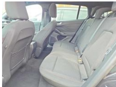
Imagen - 14