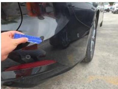
Imagen - 61