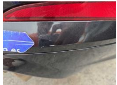
Imagen - 60