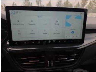
Imagen - 10