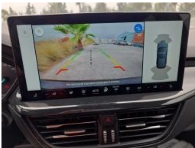
Imagen - 37