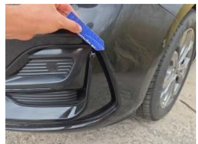
Imagen - 51