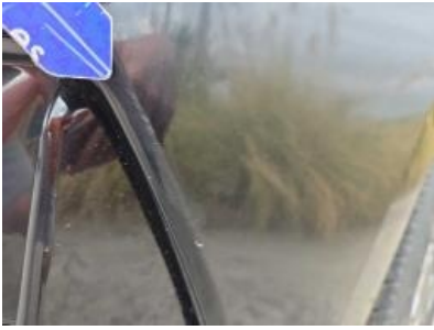
Immagine - 52