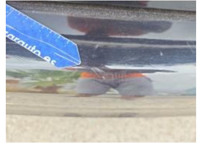
Immagine - 57