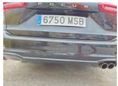
Imagen - 36