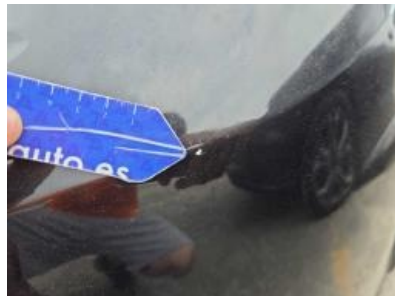
Immagine - 62