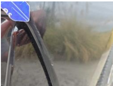
Imagen - 52