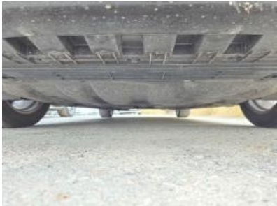
Imagen - 6