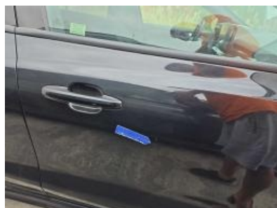
Imagen - 65