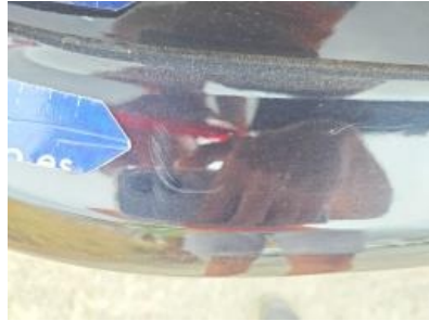
Immagine - 56