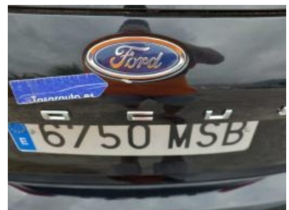
Imagen - 63