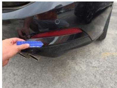
Imagen - 59