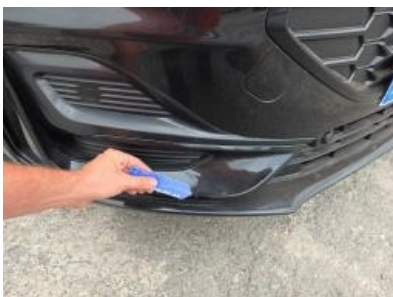
Imagen - 46