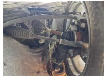
Imagen - 42