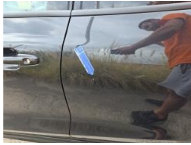
Immagine - 53