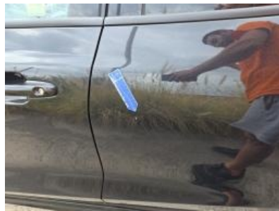
Imagen - 53