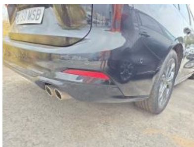
Imagen - 35