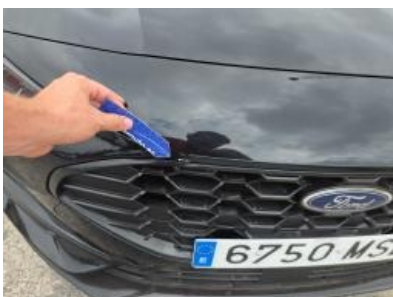
Imagen - 49