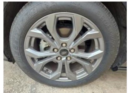
Imagen - 24