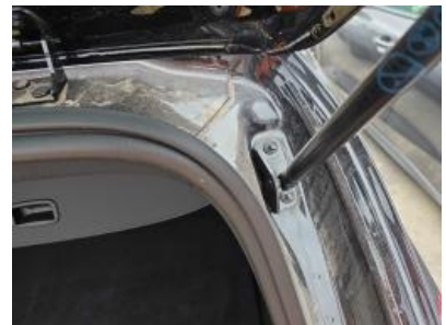
Imagen - 45