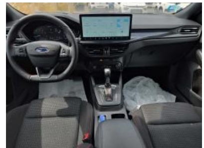
Imagen - 15