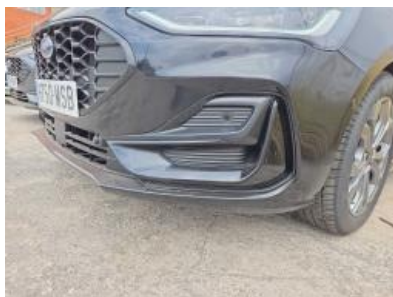
Imagen - 32