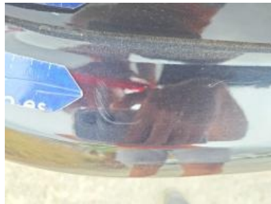
Imagen - 56