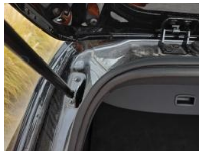
Imagen - 44