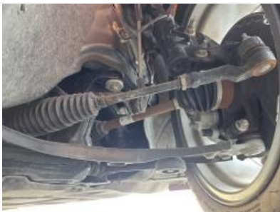
Imagen - 43