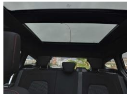
Imagen - 39