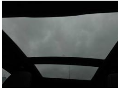
Immagine - 38