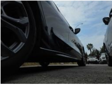
Immagine - 22