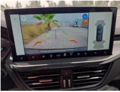
Immagine - 37