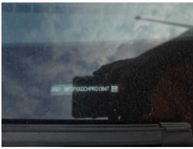
Imagen - 7