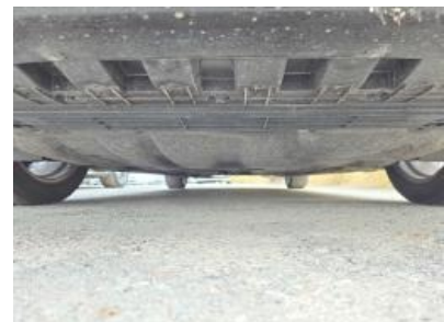
Immagine - 6