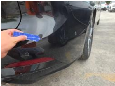
Immagine - 61