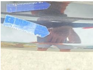
Imagen - 58