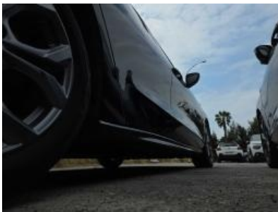
Imagen - 22