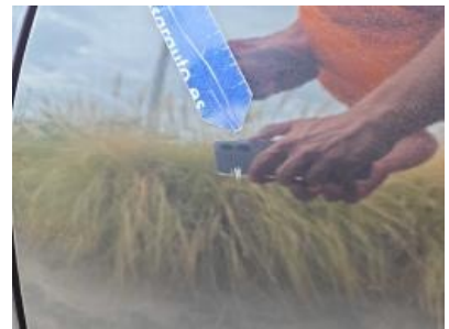
Imagen - 54