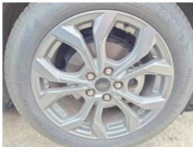
Imagen - 23