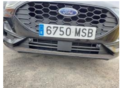
Immagine - 33