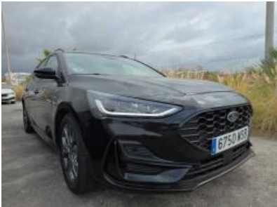
Imagen - 5