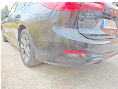
Immagine - 34