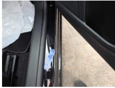
Imagen - 68