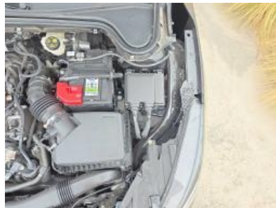
Imagen - 41