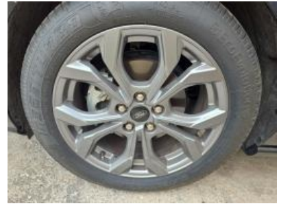
Immagine - 24