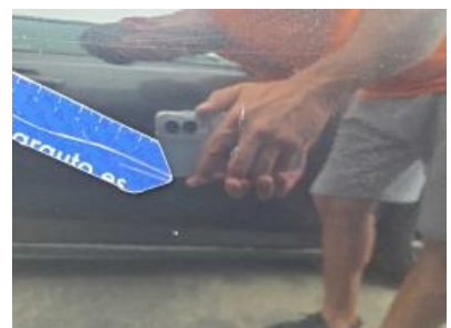
Imagen - 66