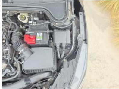
Immagine - 41