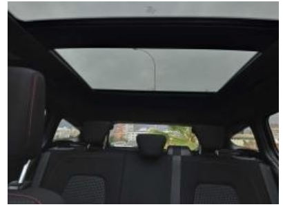
Immagine - 39