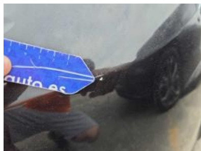
Imagen - 62