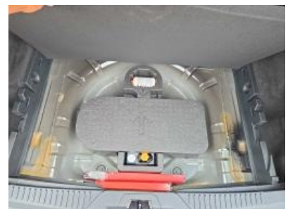
Imagen - 18