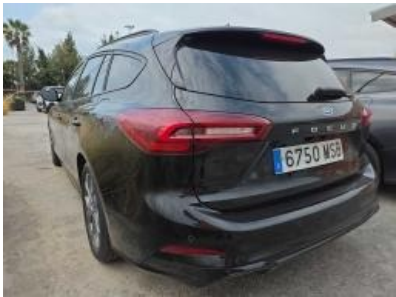
Imagen - 3