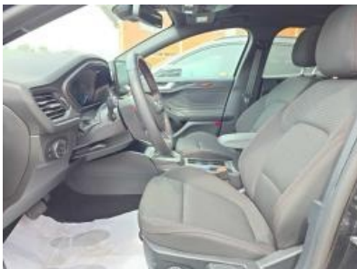
Imagen - 13