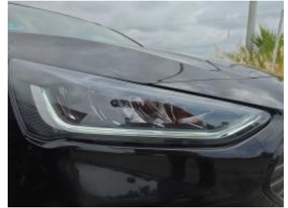
Immagine - 27