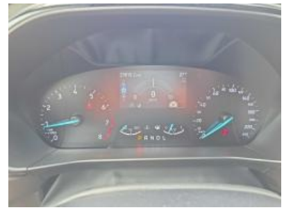
Imagen - 9