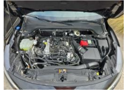
Imagen - 12