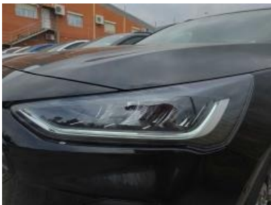
Imagen - 28