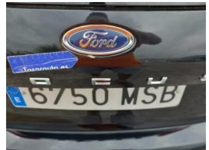
Immagine - 63