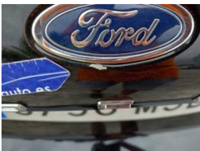
Imagen - 64