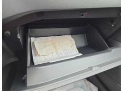
Imagen - 11