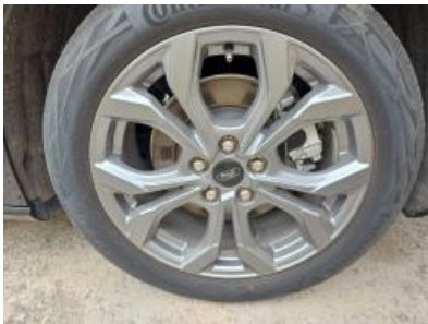
Imagen - 25