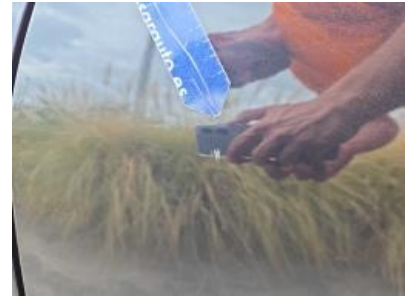
Immagine - 54