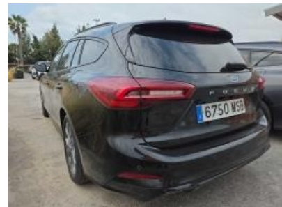
Immagine - 3