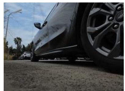
Imagen - 21