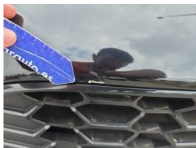
Imagen - 50