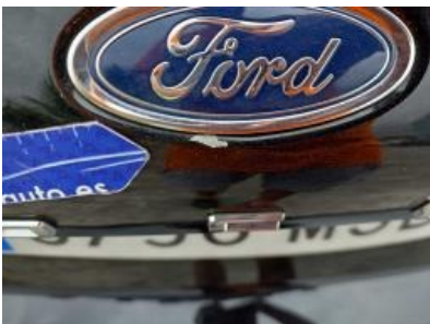
Immagine - 64