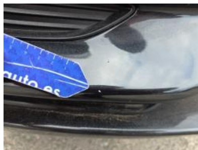
Imagen - 47