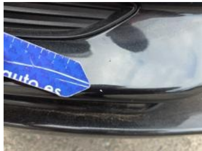
Immagine - 47