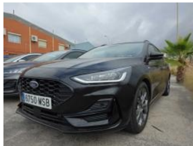
Immagine - 2