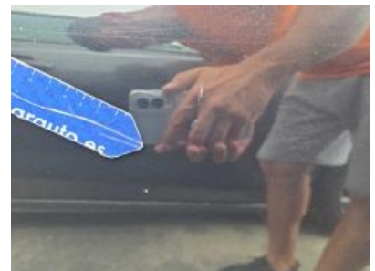
Immagine - 66