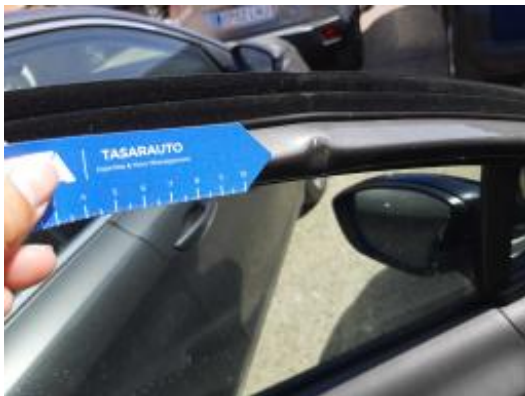
Imagen - 29