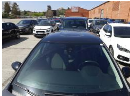
Imagen - 6