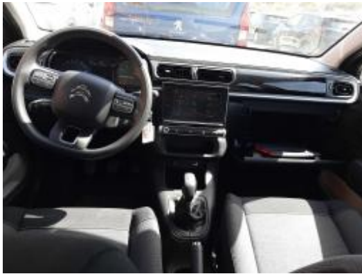
Imagen - 13