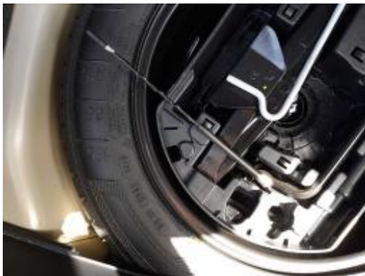
Imagen - 17