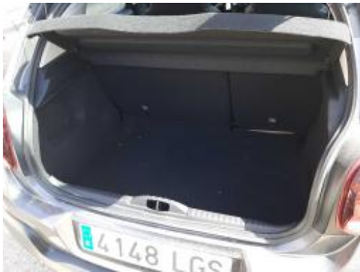
Imagen - 15