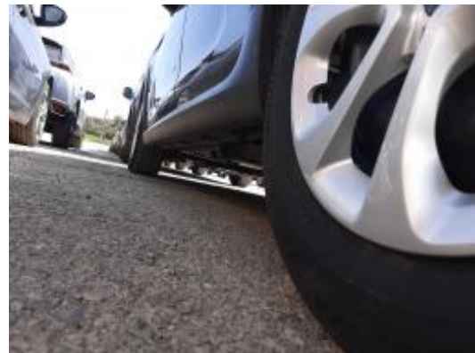
Imagen - 18