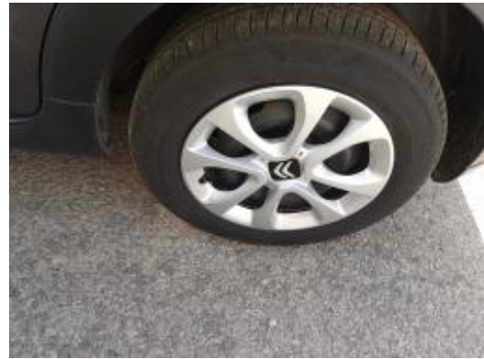
Imagen - 22