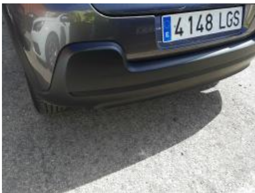
Imagen - 31