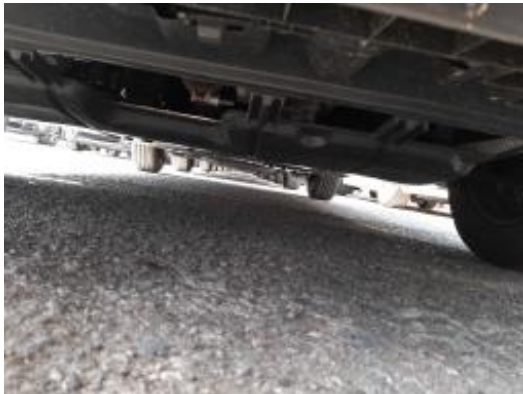
Imagen - 5