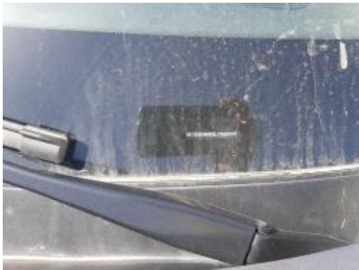
Imagen - 7