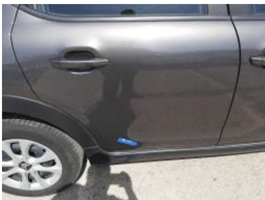
Imagen - 33