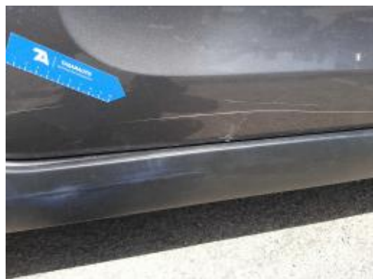
Imagen - 34