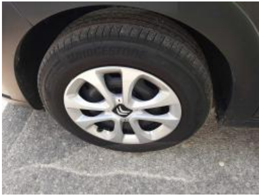
Imagen - 21