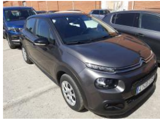
Imagen - 4