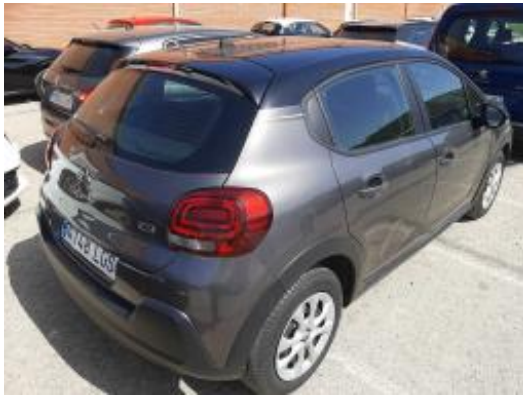
Imagen - 3