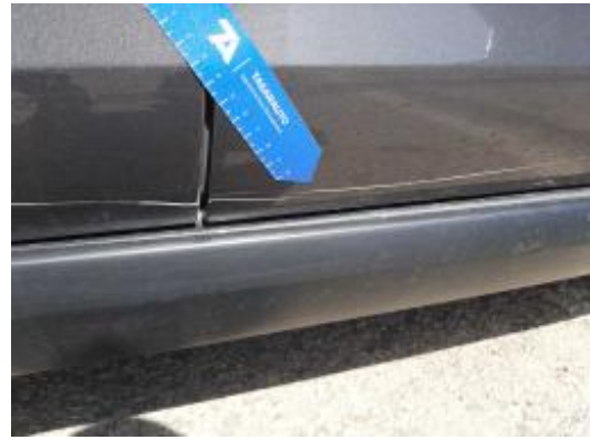
Imagen - 36