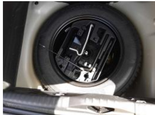
Imagen - 16