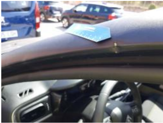
Imagen - 27