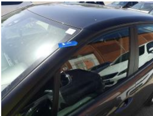
Imagen - 25