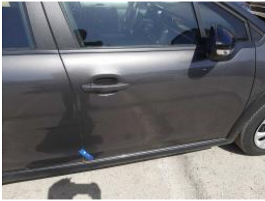
Imagen - 35