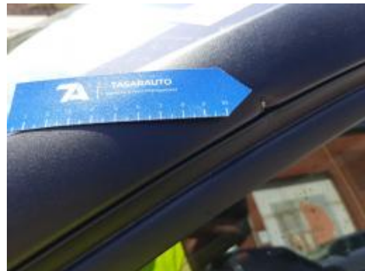
Imagen - 26