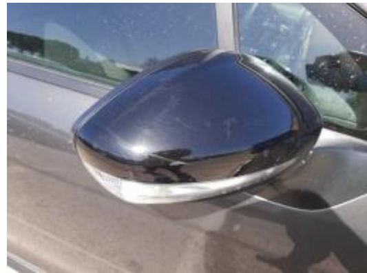
Imagen - 40