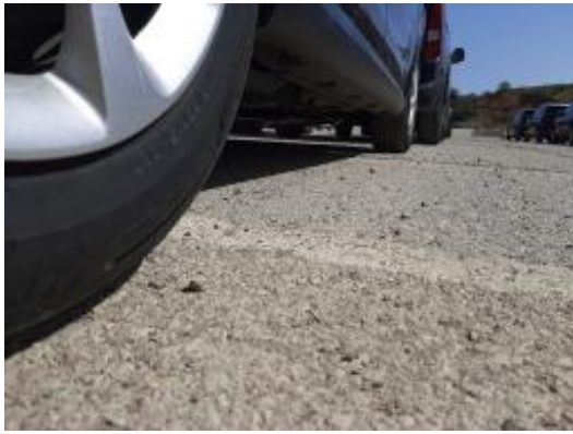
Imagen - 19