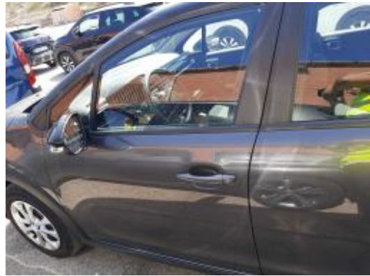
Imagen - 28