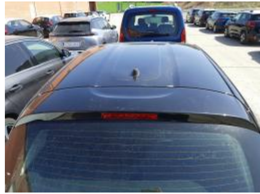
Imagen - 20