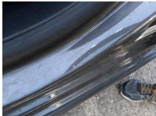
Imagen - 30