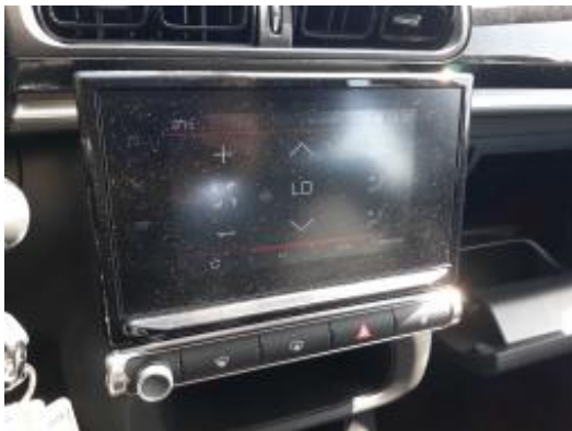
Imagen - 9