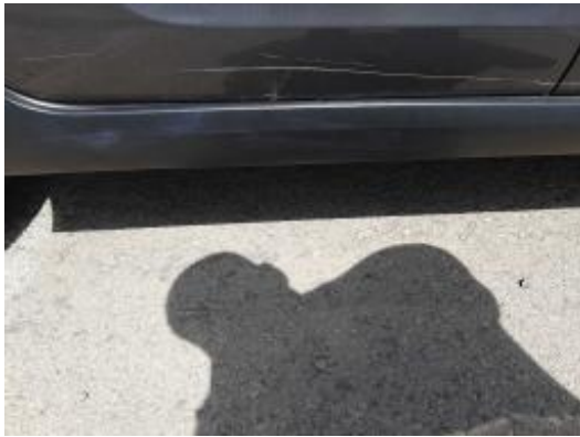
Imagen - 37