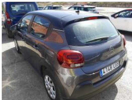
Imagen - 2