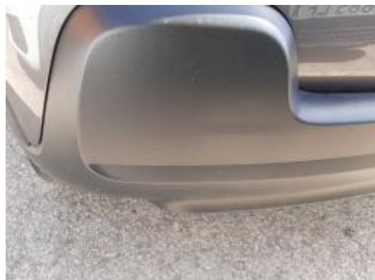
Imagen - 32