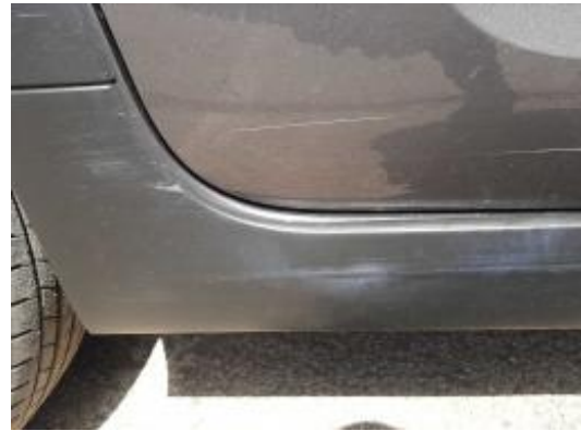
Imagen - 38