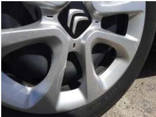
Imagen - 39