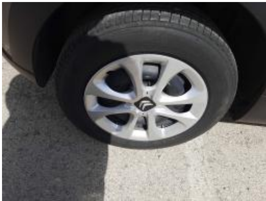
Imagen - 23