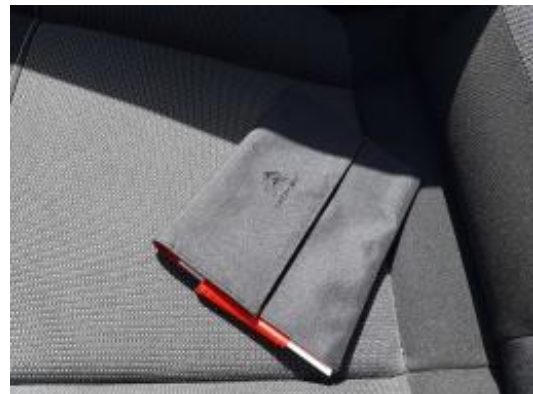
Imagen - 10