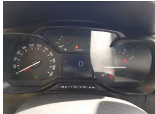
Imagen - 8