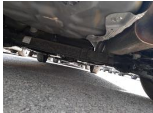
Imagen - 14