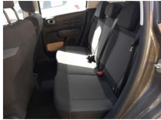
Imagen - 12