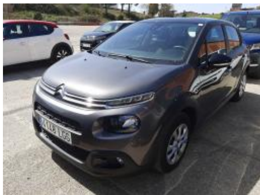
Imagen - 1