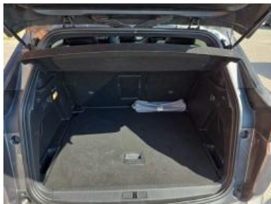
Imagem - 16