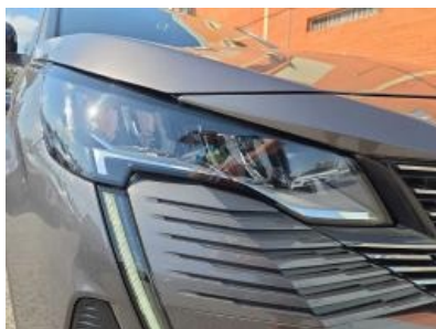
Imagem - 26