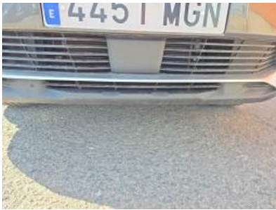
Imagem - 31