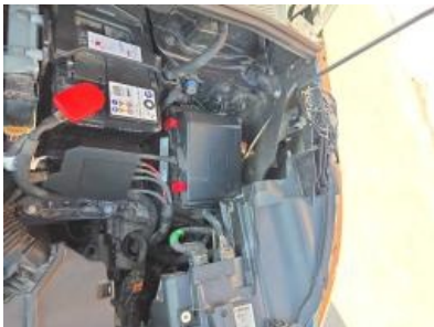
Imagem - 37