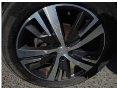
Imagem - 25