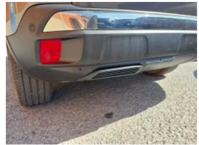
Imagem - 33