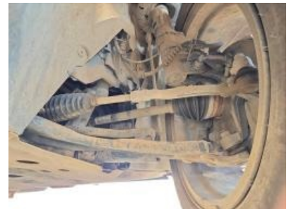
Imagem - 39