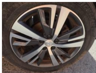
Imagem - 24