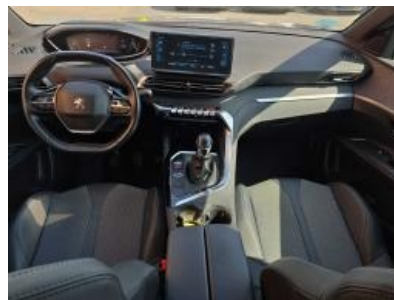
Imagem - 15