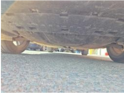
Imagem - 6