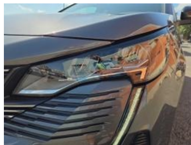
Imagem - 27