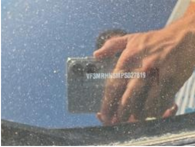
Imagem - 7