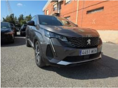
Imagem - 5