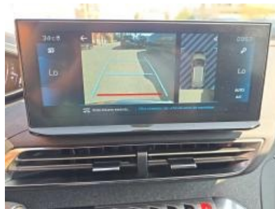
Imagem - 35