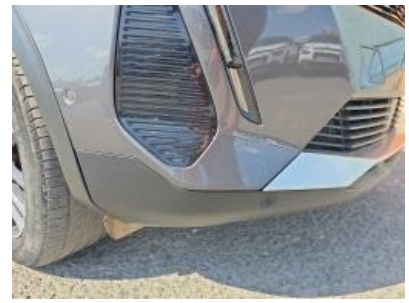
Imagem - 30