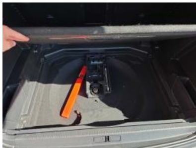
Imagem - 17