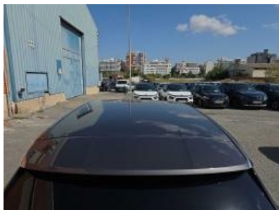
Imagem - 19