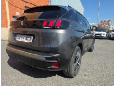
Imagem - 4