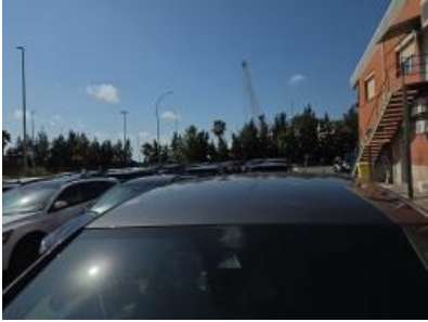
Imagem - 8