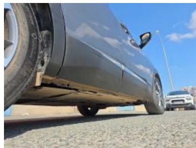
Imagem - 21