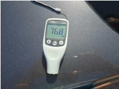
Imagem - 1