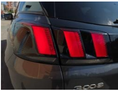
Imagem - 28