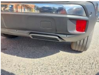
Imagem - 34