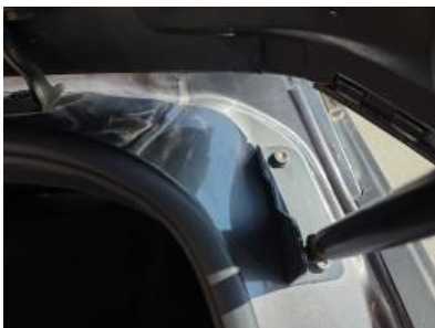
Imagem - 40