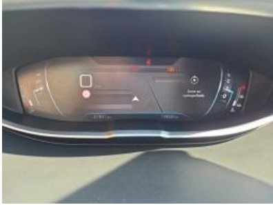
Imagem - 9