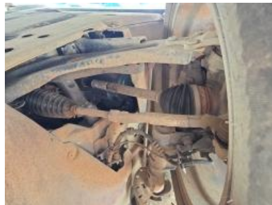
Imagem - 38