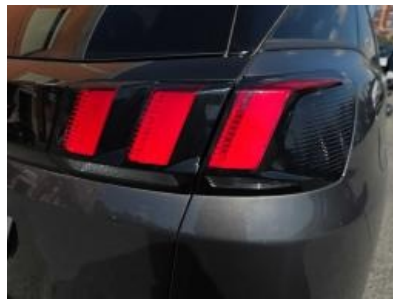
Imagem - 29