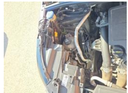
Imagem - 36