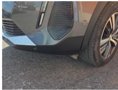
Imagem - 32