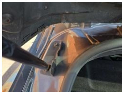
Imagem - 41