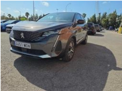
Imagem - 2