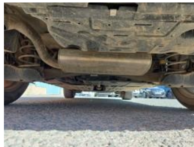
Imagem - 18