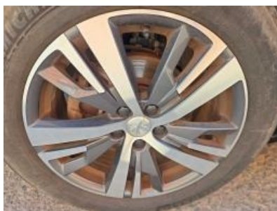
Imagem - 23