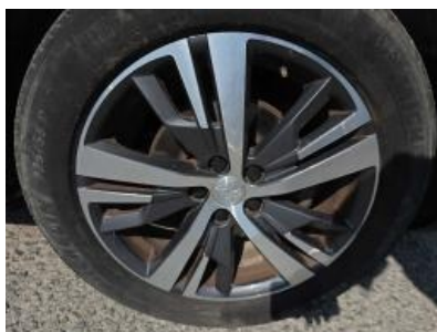
Imagem - 22