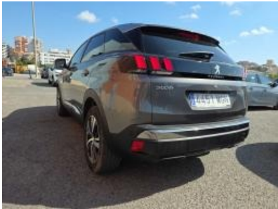
Imagem - 3