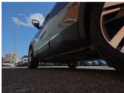
Imagem - 20