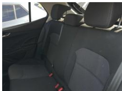
Imagen - 20