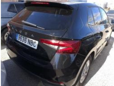
Imagen - 3