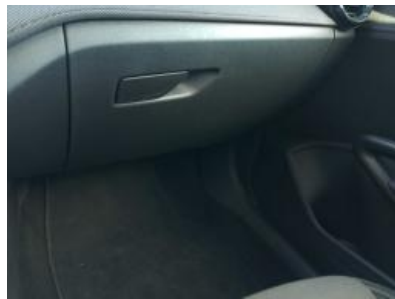
Imagen - 11