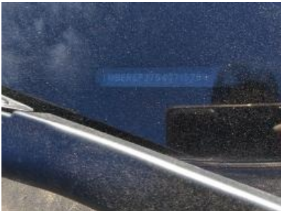
Imagen - 7