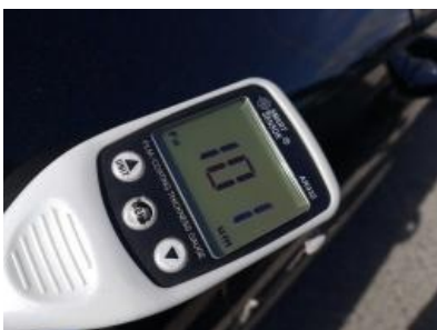
Imagen - 37