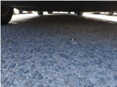
Imagen - 5