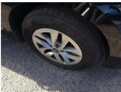
Imagen - 34