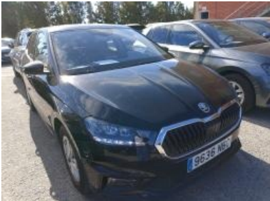
Imagen - 4