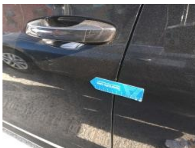
Imagen - 38