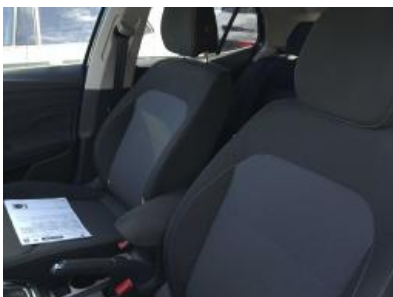
Imagen - 19