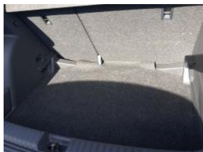
Imagen - 23