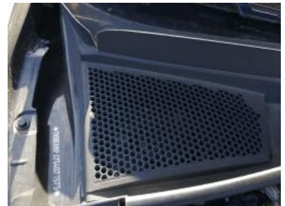
Imagen - 15