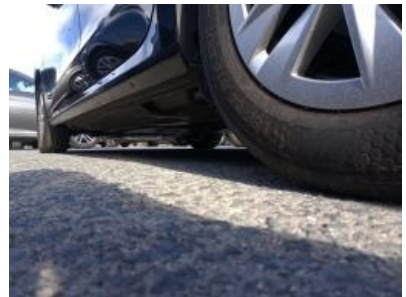
Imagen - 30