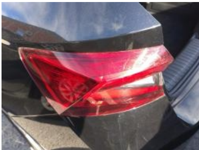
Imagen - 28