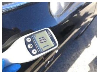
Imagen - 36