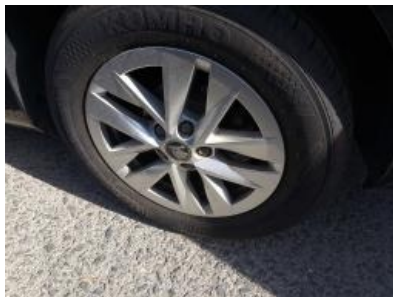
Imagen - 32