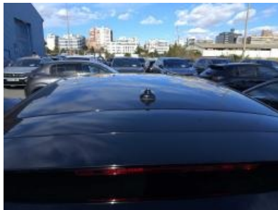
Imagen - 29