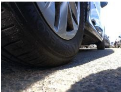
Imagen - 31