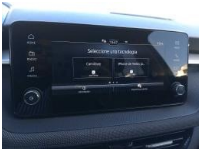
Imagen - 9