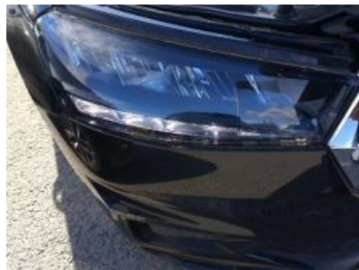
Imagen - 17