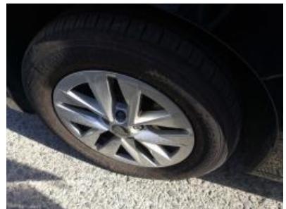
Imagen - 33