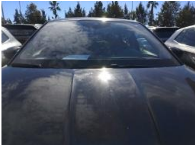
Imagen - 6