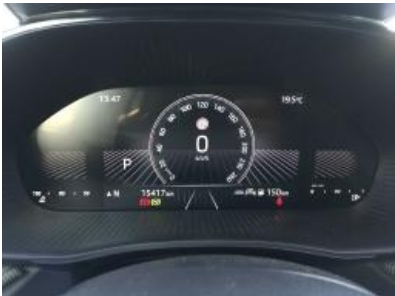
Imagen - 8