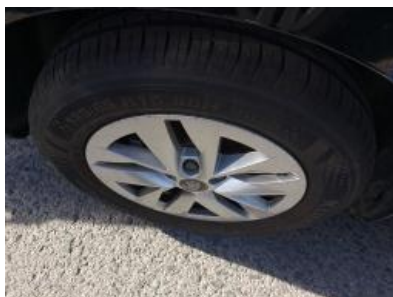
Imagen - 35