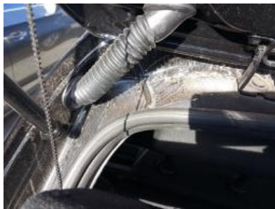
Imagen - 26