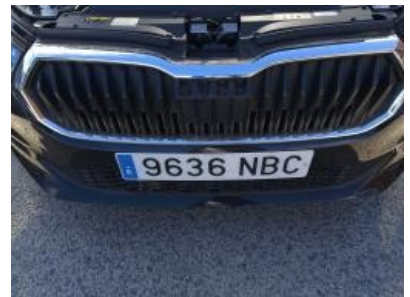
Imagen - 18