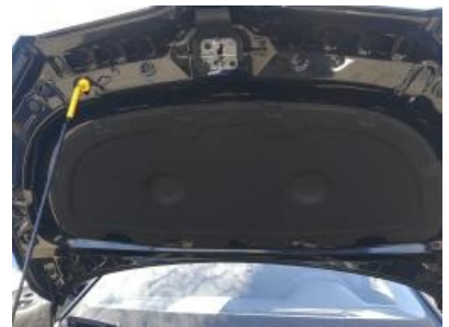
Imagen - 12