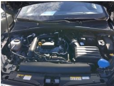
Imagen - 13