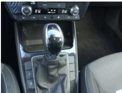
Imagen - 10