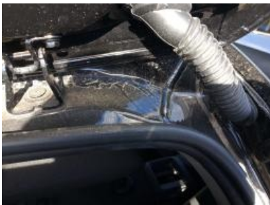
Imagen - 25