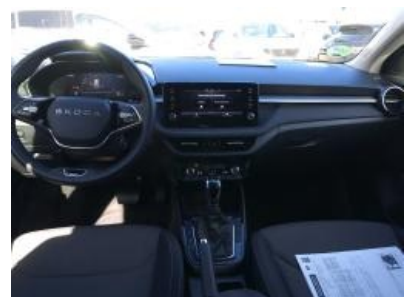
Imagen - 21