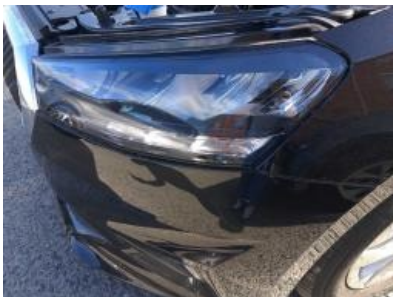
Imagen - 16