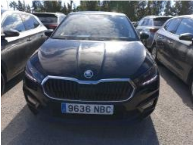
Imagen - 1