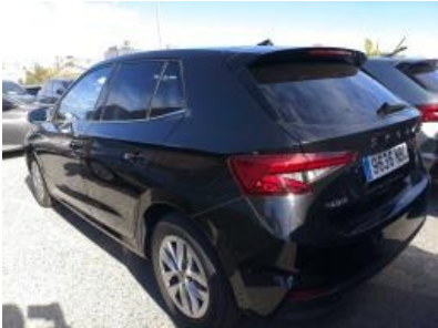
Imagen - 2