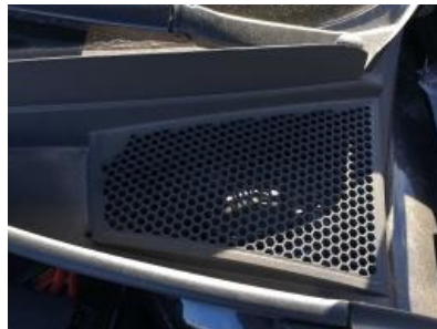
Imagen - 14