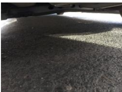
Imagen - 22