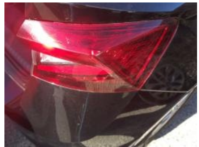
Imagen - 27