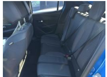
Imagen - 21