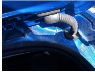
Imagen - 26