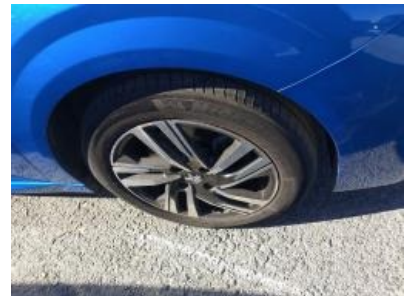
Imagen - 36