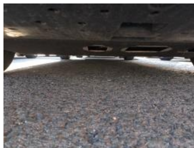
Imagen - 5