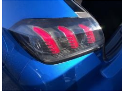
Imagen - 29