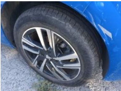
Imagen - 34