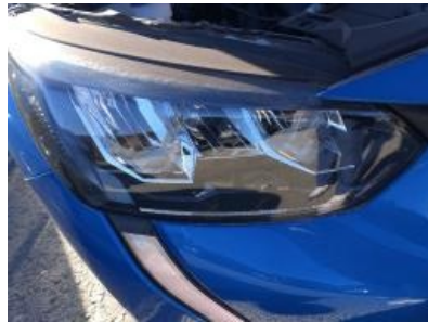
Imagen - 17