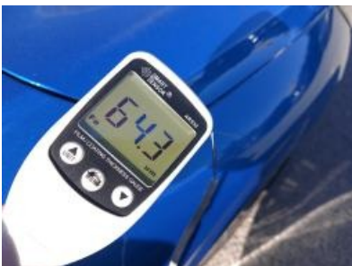
Imagen - 37