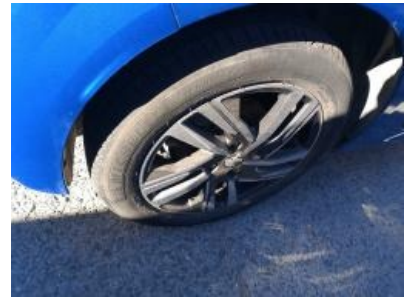
Imagen - 33