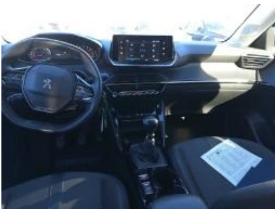
Imagen - 22