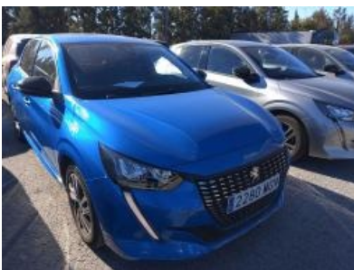
Imagen - 4