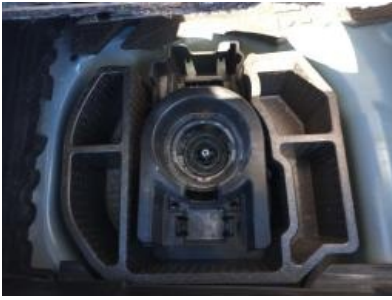
Imagen - 25