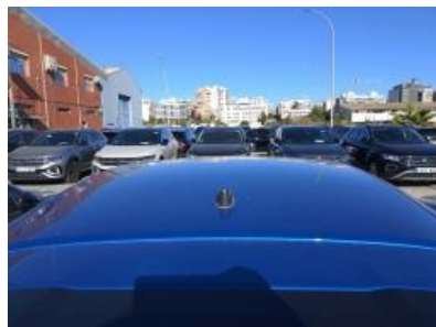
Imagen - 23