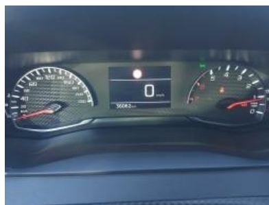
Imagen - 8