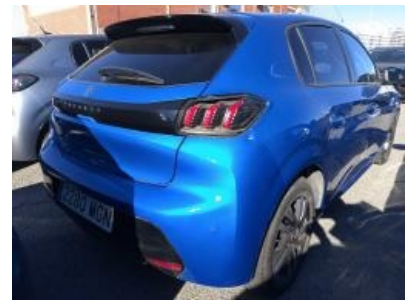
Imagen - 3