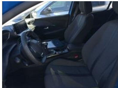
Imagen - 20