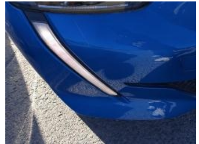
Imagen - 18