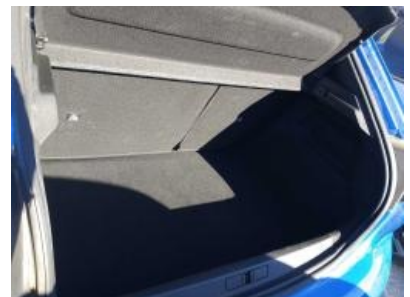
Imagen - 24