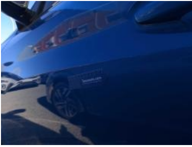
Imagen - 40