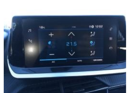
Imagen - 9