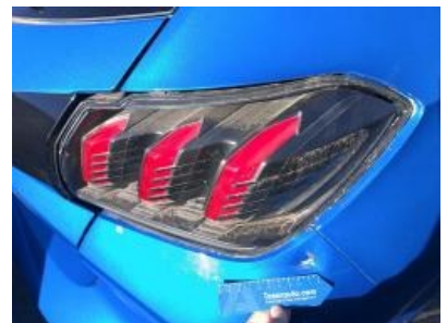
Imagen - 39