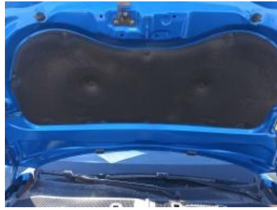
Imagen - 11