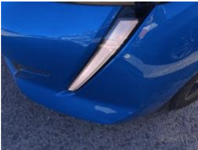
Imagen - 16