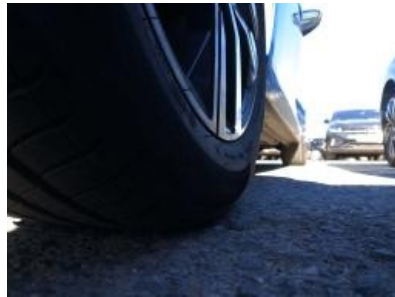
Imagen - 32