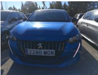
Imagen - 1