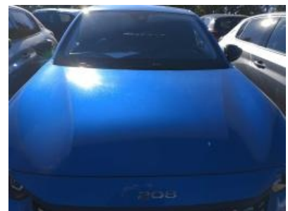
Imagen - 6