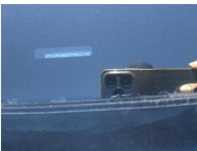
Imagen - 7