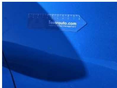
Imagen - 38