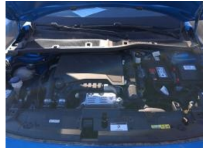
Imagen - 12