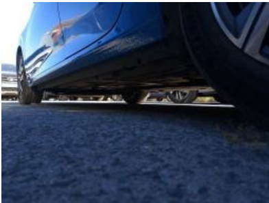
Imagen - 31