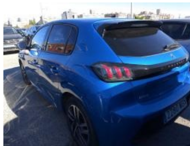
Imagen - 2