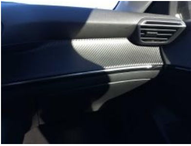
Imagen - 10