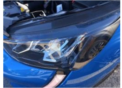
Imagen - 15