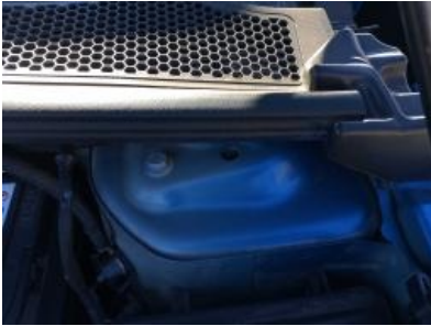
Imagen - 13