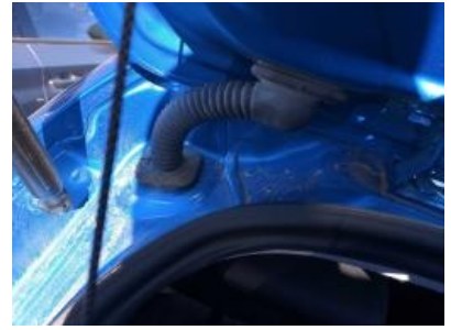
Imagen - 27