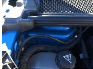
Imagen - 14