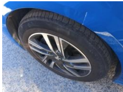
Imagen - 35