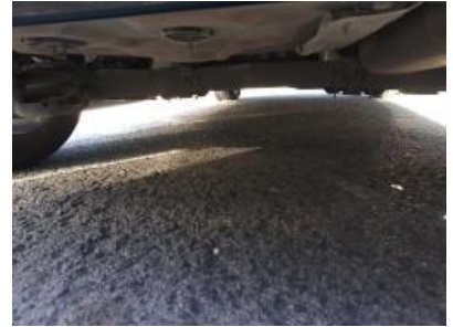
Imagen - 30