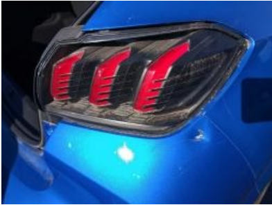
Imagen - 28